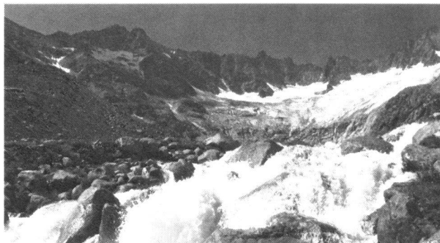
Abb. 2: Dammagletscher und Dammareuss, Göschenalp, Kt. Uri.

Die Herausforderung für die Zukunft wird sein, ein effizientes Ressourcenmanagement zu realisieren, das alle Bereiche umfasst: Landwirtschaft, Industrie, Haushalte,