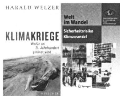
Abb. 1: Publikationen zum Thema Klimakriege und Sicherheitsrisiko Klimawandel

Sind dies Einzelmeinungen? Der Referent befürchtet nicht. Neben Harald Welzer's Buch «Klimakriege» hat auch der einflussreiche kanadische Publizist Gwynne Dyer ein Buch mit Titel «Climate Wars» veröffentlicht. Nun könnte man diese Schriften noch als überspitzte, populärwissenschaftliche Traktate abtun. Doch hat der Wissenschaftliche Beirat der deutschen Bundesregierung Globale Umweltveränderungen (WGBU) in einem Bericht mit dem Titel «Klima als Sicherheitsrisiko» genau diese Thematik aufgegriffen – übrigens unter einflussreicher Beratung Schweizer Wissenschaftlerinnen und Wissenschaftler.