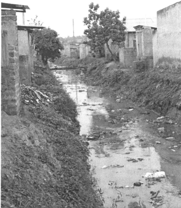
Abb. 2: Wasserprobleme: Afrika zum Dritten (Alfred Bürgi)

dingungen reagierte: 1979 – 1985 war der Norden relativ ruhig, und Helvetas konnte gute Projektergebnisse vorweisen. Mit dem Übergreifen des Bürgerkrieges auf den Norden musste Helvetas 1986 – 1992 die Aktivitäten reduzieren. Mit dem Einzug demokratischer Verhältnisse wurde auch eine staatliche Wasserpolitik ins Leben gerufen und die Gemeinden mit der Realisierung beauftragt. Für Helvetas gestaltete sich die Arbeit dadurch zunehmend komplexer, und man begann ab 1999 zielorientiert unter dem Stichwort der Nachhaltigkeit zu arbeiten, was bis 2004 wieder Fortschritte brachte. 2004 – 2008 vergab die Direktion für Entwicklungszusammenarbeit die Projektarbeit an eine ameri-