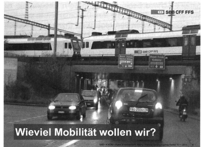
Abb. 4.: Wie viel Mobilität wollen wir?

Die angeregte Frage- und Diskussionsrunde macht noch einmal deutlich, wie gross das Interesse an der SBB und an der Entwicklung des öV ist.