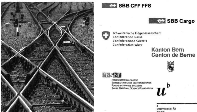
Abb. 1: Weg zum Delegierten Government & Public Affairs (SBB-Kommunikation)

Der Referent bezeichnet die Arbeit an Schnittstellen, sowohl thematisch wie von der Rolle her, als Schnittmenge all seiner Tätigkeiten (Abb. 1). In der Assistenzzeit am GIUB war die Schnittstelle die Zusammenarbeit zweier Arbeitsgruppen, dann die Universitäten Bern und St. Gallen in einem interdisziplinären Gemeinschaftsprojekt zum «ökologischen Strukturwandel durch Innovationen», das er im Rahmen des Schwerpunktprogramms Umwelt leitete. Als Geschäftsführer des Programms kantonale Entwicklungsschwerpunkte beim Amt für Gemeinden und Raumordnung des Kantons Bern arbeitete er an den Schnittstellen von Raumplanung, Verkehrsplanung und Wirtschaftsförderung. Und im Direktionsstab «öffentliche und gemeinwirtschaftliche Unternehmen» des UVEK als wissenschaftlicher Mitarbeiter und späterer Leiter hatte er erstmals Kontakt mit der Unternehmenswelt.