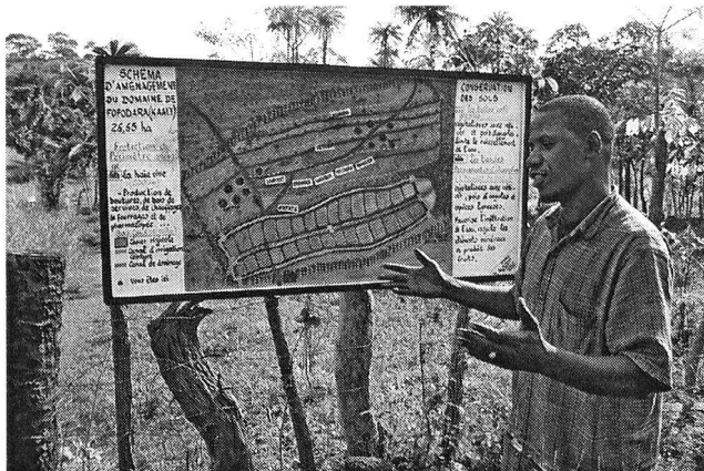
Abb. 3: Massnahmen des «Watershed managements» in Pakistanisch-Kaschmir.

Einige Punkte stellen besondere Herausforderungen an die Projekte: Nachhaltigkeit auch nach Abschluss des Projektes; Engagement und Zuverlässigkeit der Regierungen und Partner; Anpassung der Vorgehensweisen an die Erwartungen der PartnerInnen, sowie an die nationalen bzw. lokalen natur- und kulturräumlichen Gegebenheiten.