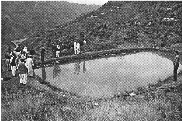
Abb. 2: Einbezug der lokalen Bevölkerung in Pakistanisch-Kaschmir.

wurde ein Projektteam gebildet. Es folgten Schadenkartierungen. Das Watershed Management Committee stellte einen integrativen Aktivitätenplan auf. Er enthält ein Mosaik von Interventionen, welche die Lebensbedingungen verbessern sollen: Natürliche und künstliche Verbauungen, Aufforstung, Terrassenbau, Errichten von Hausgärten zur Bildung von Einkommen, Häuserbau, Errichten von Wassersammlern, Fischteiche, Entwickeln von Kunsthandwerk und Kursen, um ein nicht-landwirtschaftliches Zusatzeinkommen zu erzeugen.