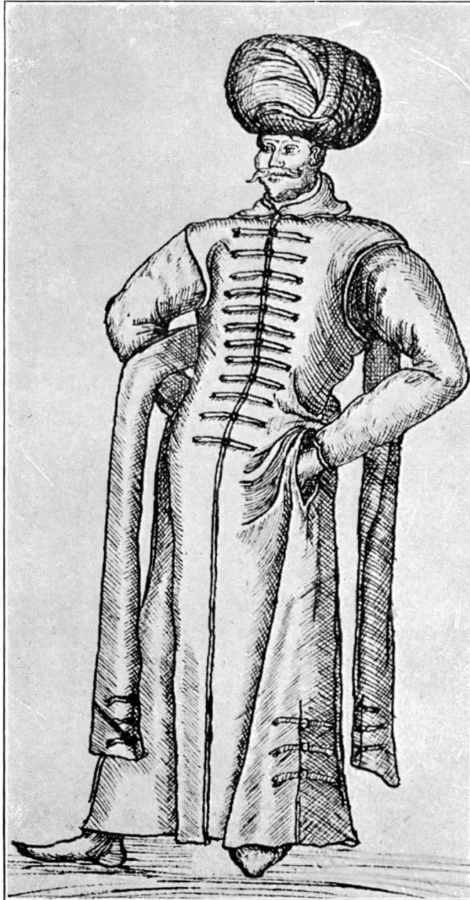
Venezianischer Senator als Jerusalempilger (nach Sebastian Werro 1581)