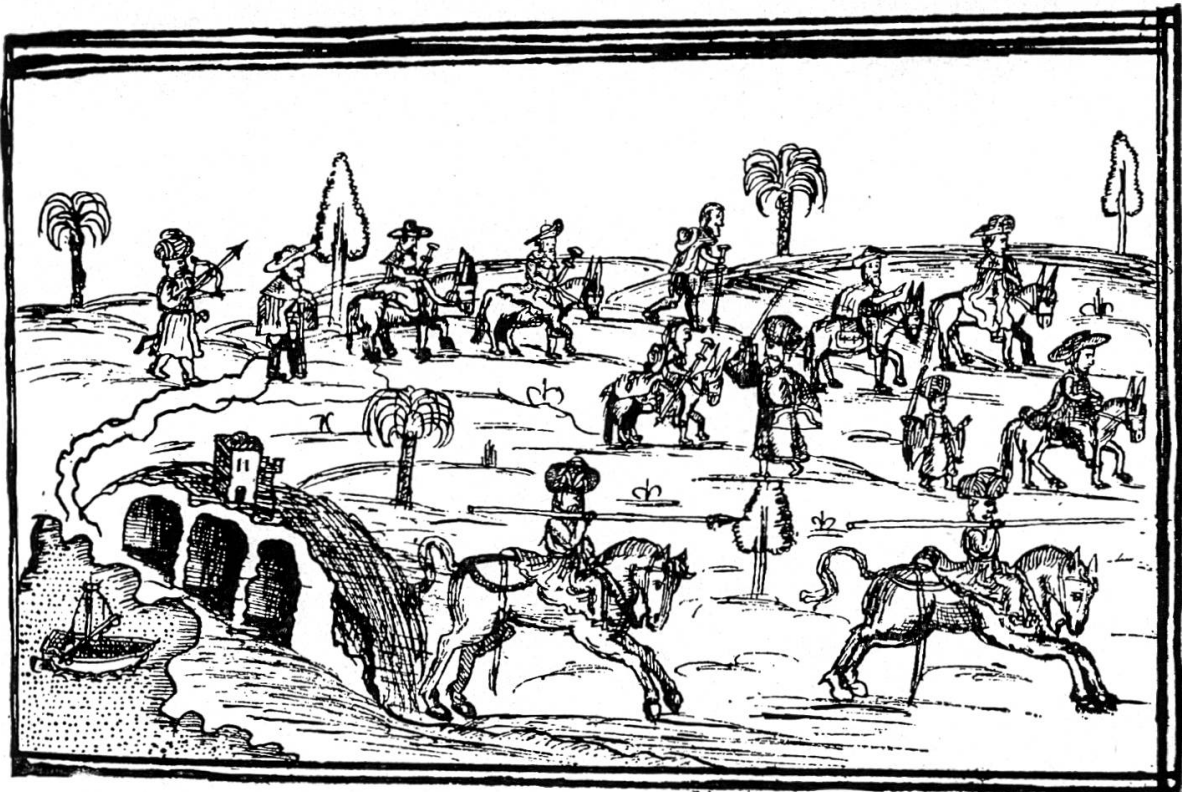
Pilger auf der Fahrt zum hl. Grab (Federzeichnung)