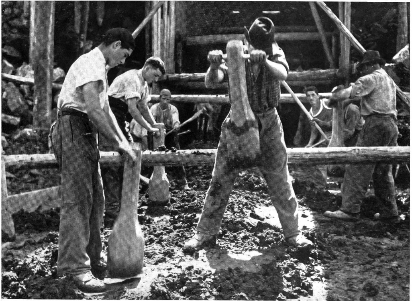
Jede Rollwagenladung wird mit Hilfe von Holzstößeln eingestampft, um einen kompakten Lehmkern zu erhalten (siehe S. 218).