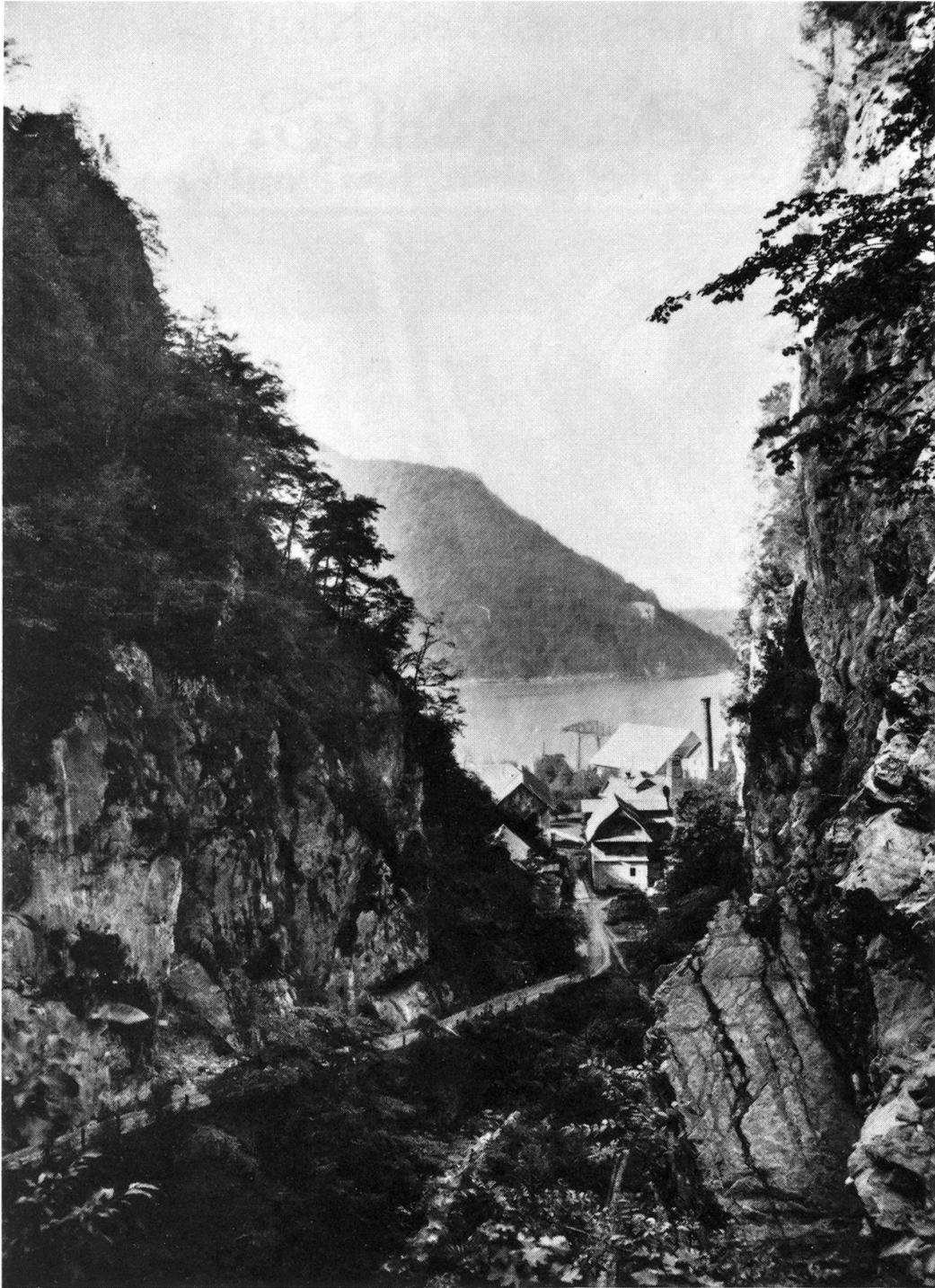
Blick durch die Rotzschlucht Richtung WNW, Aufnahme ca. 1900