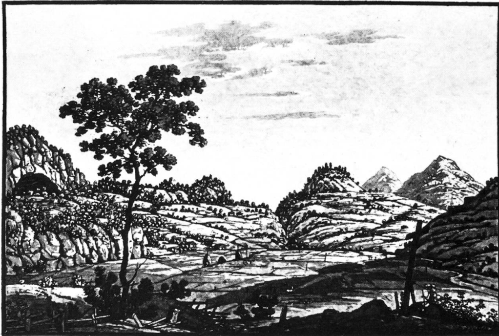
Drachenrieth und der Rotzberg. Aquatinta, Basel bey Maehly und Schabelitz ca. 1810. Original 7 x 10,5 cm.

siedelten Gewerbebetrieben, sondern auch der Schwefelquelle, einem alkalisch-salinischen, schon seit vielen hundert Jahren bekannten Heilwasser. Schwefelquellen haben immer etwas Geheimnisvolles an sich, wird doch der Teufel mit Pech und Schwefel in Verbindung gebracht.