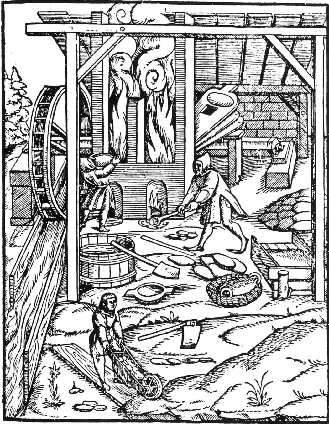
Mittelalterliche Schmelzhütte, Kopie ab Druck Bildarchiv Zentralbibliothek Luzern.