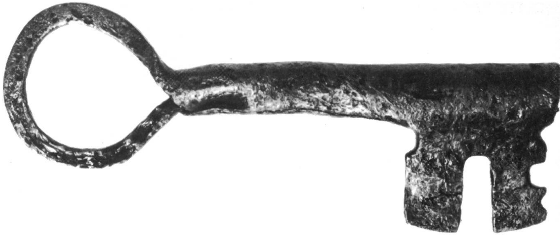
Abb. 3 Auf dem Bauniveau des «Tellers» fand sich mitten unter den Holzspänen ein gut erhaltener Schlüssel, der aus einem Stück mit hohlem Schaft gefertigt ist und einen einfachen Bart aufweist. Zeitstellung: 13. Jahrhundert.