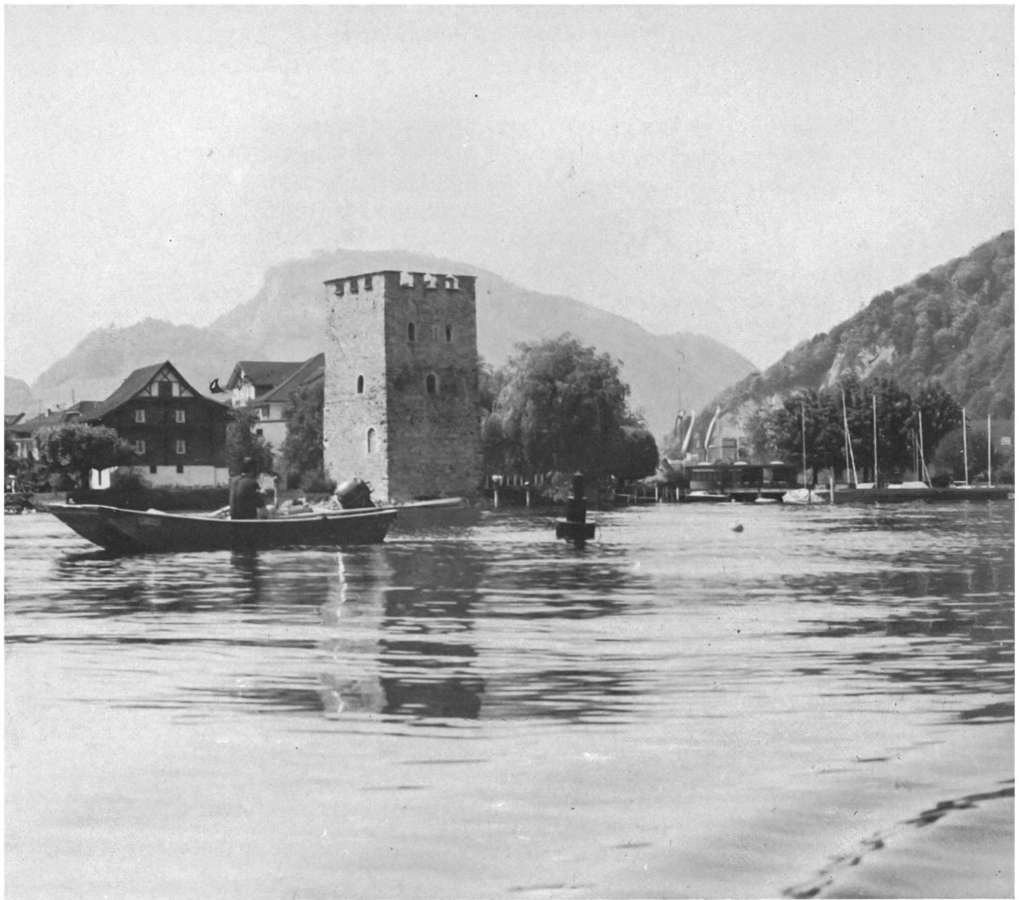
Abb. 4 Schnitzturm. Der 1428 erstmals urkundlich erwähnte Turm ist aus burgenkundlichen und historischen Überlegungen in die Zeit kurz nach dem Morgartenkrieg zu datieren.

Die Fenster- und Türöffnungen stammen aus dem 16. Jahrhundert. Der Zinnenkranz wurde um 1880 rekonstruiert. Ursprünglich dürfte der Turm ein flaches Pyramidendach getragen haben.