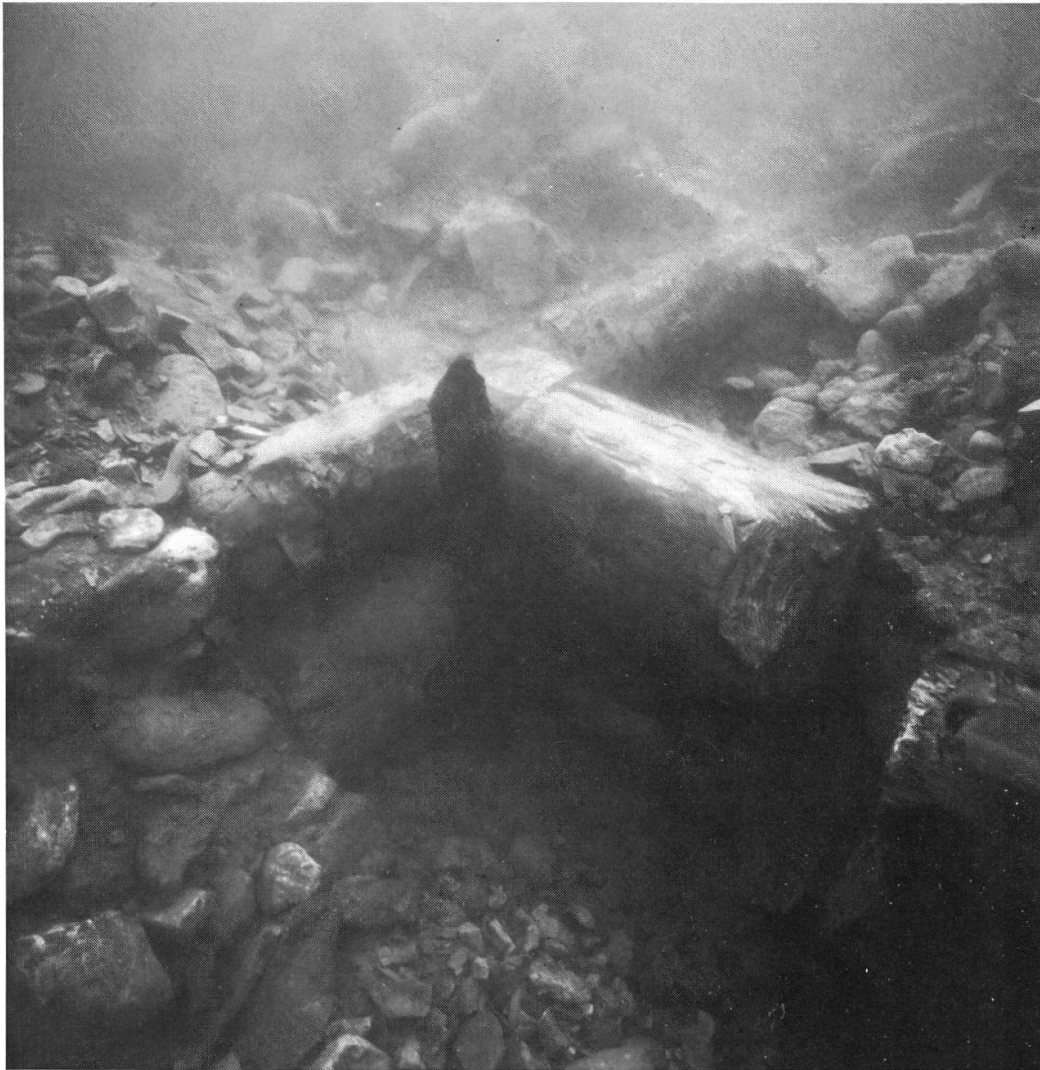
Abb. 2 Bei archäologischen Tauchuntersuchungen im See vor dem Stansstader Schnitzturm wurde auf dem «Teller» das bisher unbekannte Fundament eines rechteckigen Wehrturmes in Blockbautechnik entdeckt.

kumentation unmöglich und bei der Einmessung von Bojen (Planaufnahme) ergaben sich grosse Ungenauigkeiten. Bei der zweiten Etappe waren die Verhältnisse günstiger. Allerdings trafen wir doch nicht so klares Wasser an, dass sich Fotos mit optimaler Schärfe hätten schiessen lassen. Der Alpnachersee war zur Zeit der zweiten Aktion so trübe, dass überhaupt keine Beobachtungen mehr angestellt werden konnten. Wir mussten den Plan fallenlassen, auch die Reste des dortigen Steinwalles (L bei Durrer) in die Untersuchung miteinzubeziehen. Es blieb bei den wenigen Beobachtungen, die wir während der ersten Etappe gemacht hatten.