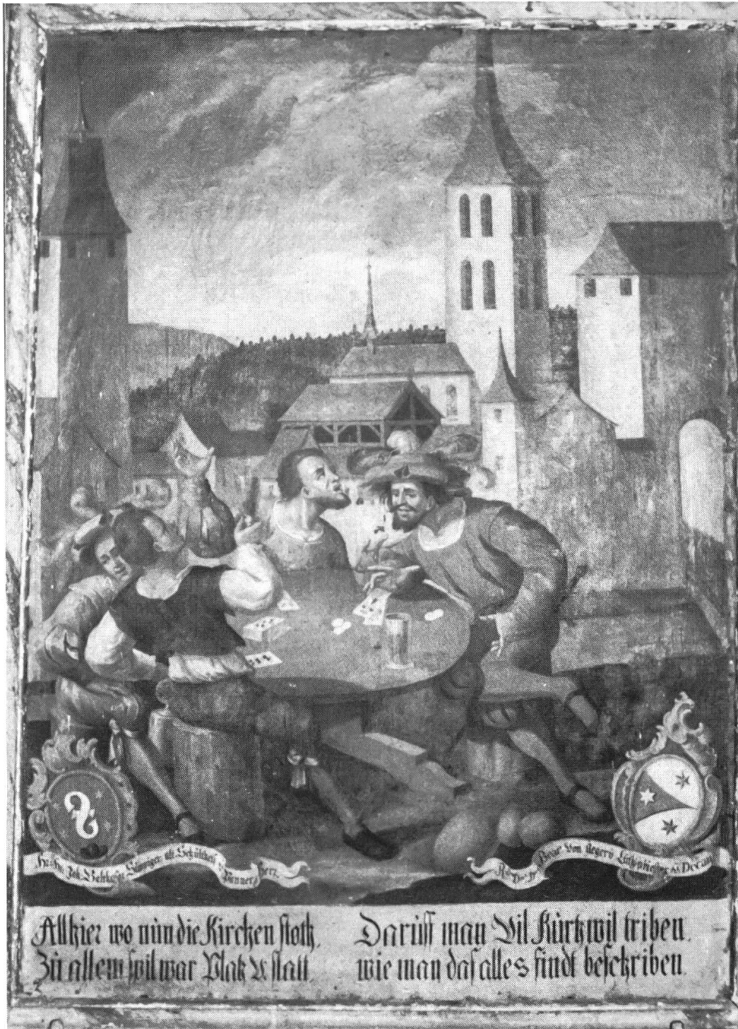
Aus dem Bilder-Zyklus der Heilig-Blut-Kapelle in Willisau (heute im Landvogteischloss). Die Spieler verwenden Kaiser-Karten.