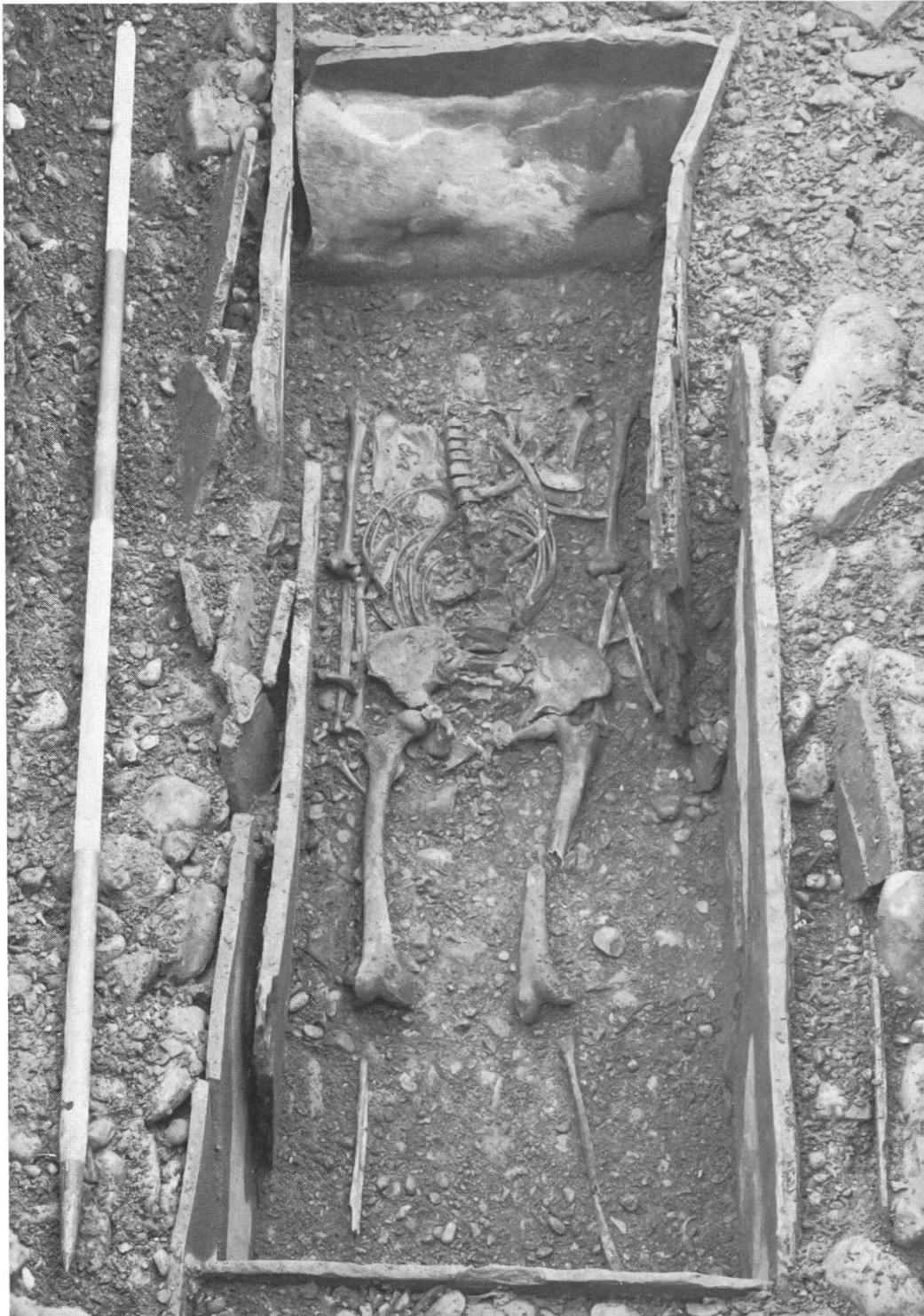
Stans: Brisenstrasse. Steinkistengrab eröffnet.