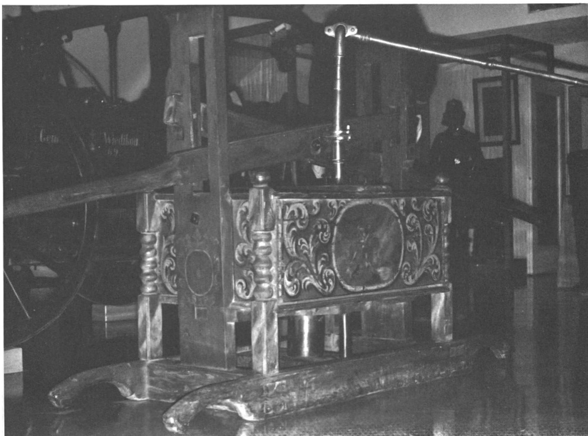
12. Schucke Schlagspritze aus dem Jahre 1707. Der Kolben wird mit zwei Druckstangen auf- und abwärts bewegt, das Wasser mit dem «Schwanenhals» (Wenderohr) auf das Feuer gelenkt. Die eine Schmalseite trägt den Spruch: «Man brucht Mich in der Noth / Dar Vor behüet Euch Gott 1707.» — Die Spritze stammt aus Ossigen, Kt. Zürich. Städtische Brandwache Zürich.

dung bezahlen 10 . Dieser Problemkreis beschäftigte den Wochenrat später bei einem Streit um einen Gartenzins wieder 11 , dann auch bei der Auszahlung einer «Garten-Entschädigung» 12 .