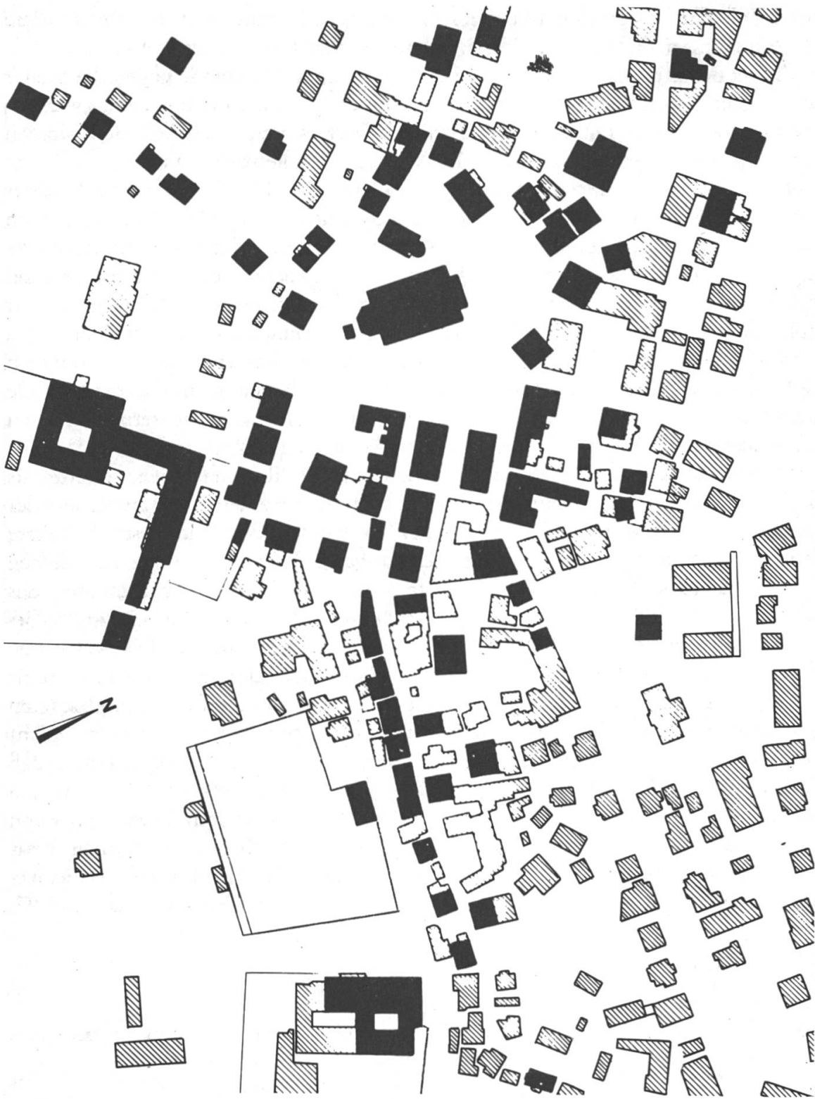
15. Planskizze des Dorfes, wie es sich 1756 präsentierte. Aus dem Plan wird ersichtlich, dass die Anlage der Strassenzüge und der Plätze in der heutigen Form im frühen 18. Jahrhundert zugrundegelegt wurde. — Plan: Paul Furger.