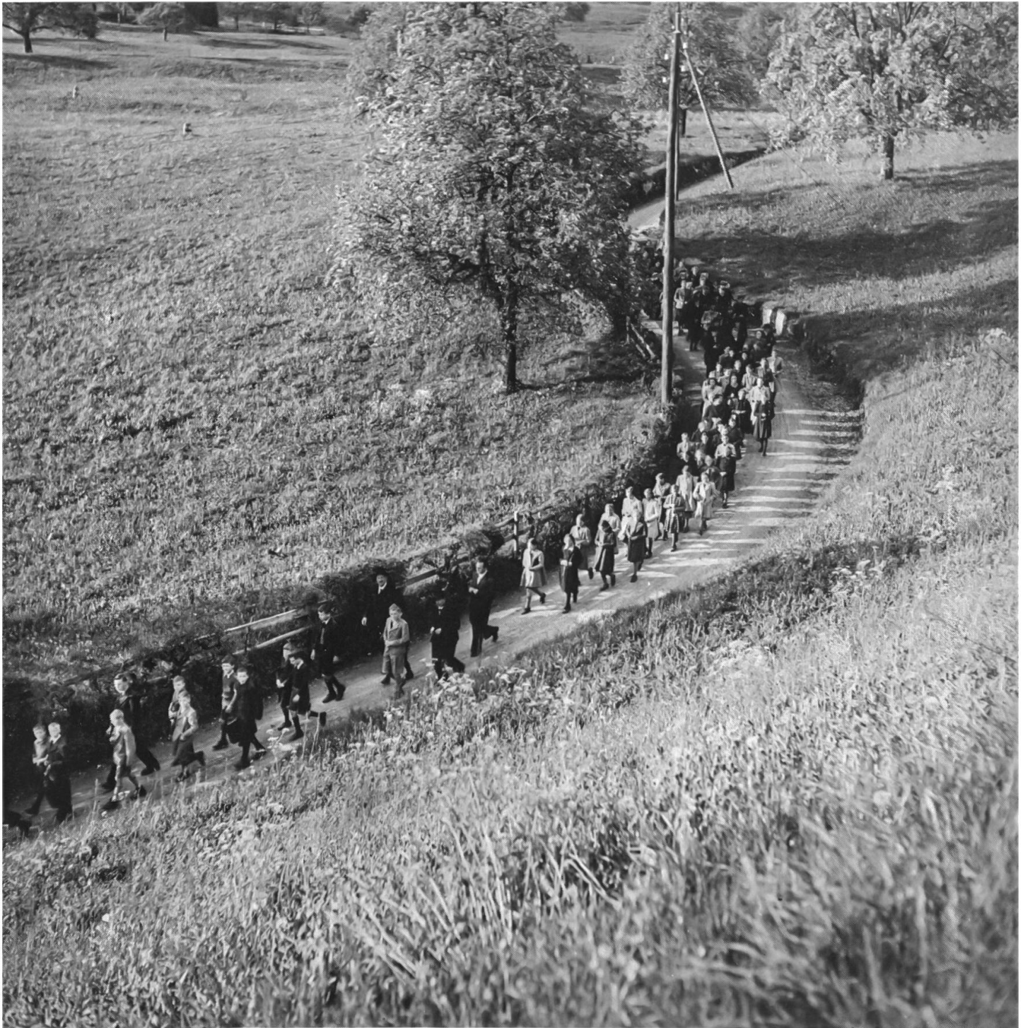
11 Die Teilnahme an Wallfahrten, Bittgängen und andern religiösen Feiern gehörte bis in die neuere Zeit ganz selbstverständlich zum bäuerlichen Leben. Die Landeswallfahrt nach Buochs dient der Bitte um ein gutes Gelingen der Landsgemeinde. Das Bild zeigt den Prozessionszug auf der Ennerbergstrasse nach der Passhöhe Richtung Buochs am 25. April 1939. Die schmale, dem Gelände angepasste Strasse ist mit Hecke und Steinmauer gesäumt. Diese Strasse ist heute, wie viele andere alten Wege, zu einer öden Strassenpiste ausgebaut.