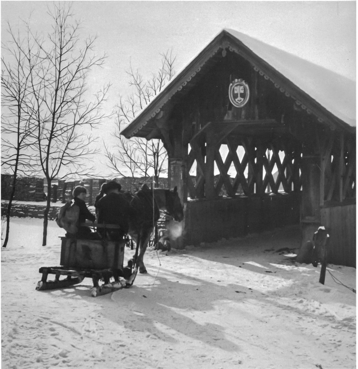
12 Eine Fahrt ins Dorf zum Handel oder zu einem Handwerker war vor dem Aufkommen des privaten Verkehrs für die Bauern auf den Streusiedlungen ein Ereignis, das mindestens einen halben Tag beanspruchte. Im Winter war der Pferdeschlitten auf den schneebedeckten Wegen ein ideales Fuhrwerk. Von Buochs bis Wolfenschiessen boten viele hölzerne Brücken Übergänge über die Engalbergeraas. Die abgebildete Aabücke bei Wil war 1882 erneuert worden. Die ältere Brücke hatte an einem Tragbalken des Daches die Jahrzahl 1544 eingeschnitzt. Die Holzbrücke ist 1969 durch eine Betonbrücke ersetzt worden. Aufnahme vom Winter 1938/39.