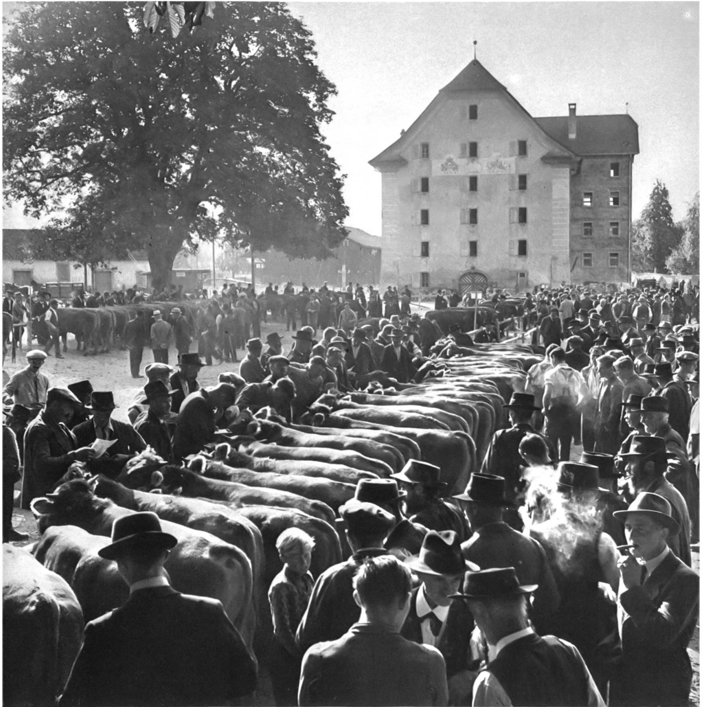
7 Die Viehzeichnung zu Wil an der Aa, eine kantonale Viehprämierung, erfolgt in der Regel in der ersten ganzen Oktoberwoche. Bis 1964 fand die Viehzeichnung im Raum zwischen Landsgemeindeplatz und dem 1775 erbauten Kornhaus (heute Zeughaus) statt. 1965 wurde erstmals das Areal nördlich der Kasernenstrasse bezogen. Seit 1967 wird dort jeweils für die Viehzeichnung eine demontierbare Anbindevorrichtung aufgestellt. Bild von der Viehzeichnung im Oktober 1942.