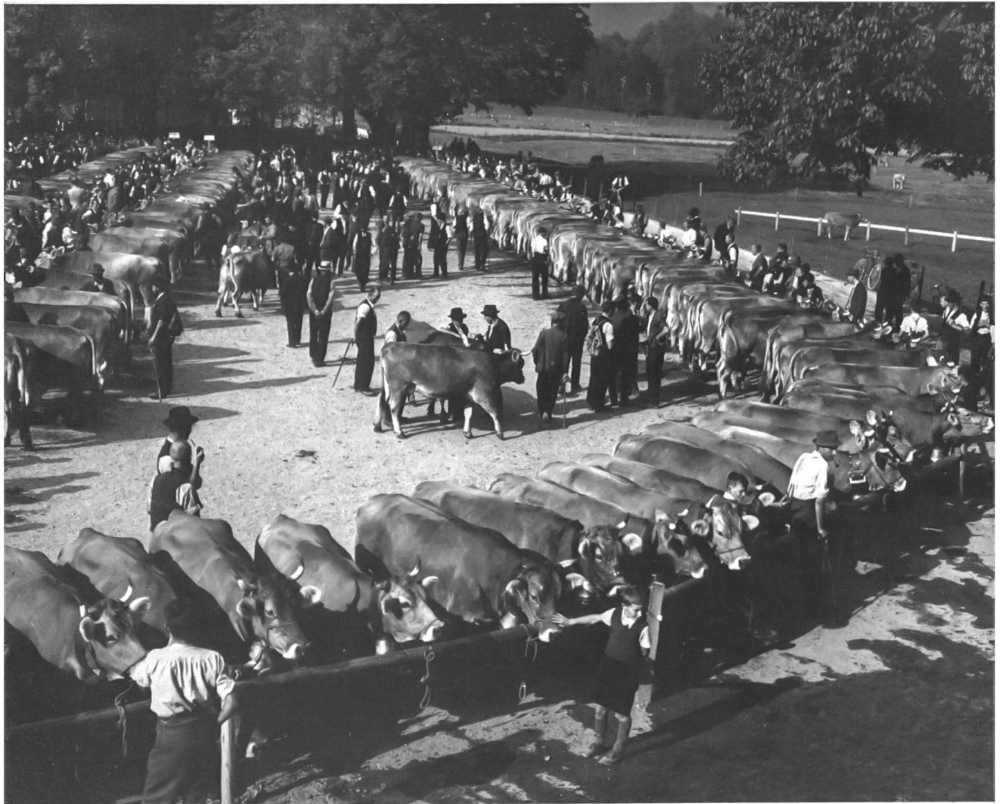
8 Gemäss der kantonalen Verordnung betreffend die Förderung und Veredelung der Viehzucht vom 27. November 1919 hat die Viehzeichnung von Gesetzes wegen stattzufinden. Doch schon vor den gesetzlichen Massnahmen des Bundes zur Förderung der Landwirtschaft kamen Prämienschauen vor. Die erste Prämienschau für Zuchtstiere in Wil kann 1864 nachgewiesen werden. An der Viehzeichnung für Rindvieh darf nur die braune Rindviehrasse prämiert werden. Zweck dieser Viehschau ist die Präsentation des angestrebten Zuchtzieles. Früher wurde auf das Exterieur der Tiere zu grosses Gewicht gelegt. Die heutigen Qualitätskriterien, wie zum Beispiel Milchleistung und Schlachteigenschaften, sind weitgehend vom Absatzmarkt her bestimmt. Bild von der Viehzeichnung im Oktober 1942.