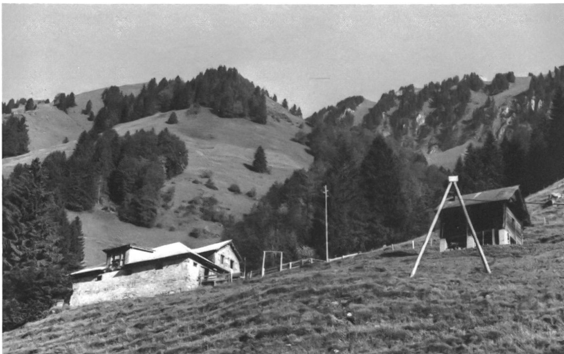
14 Alp Schultern, Teil der Wiesenberger Treichialpen. Im Hintergrund das Bergheimen Unterholzwang. Auf den Treichialpen hat sich die Grenze zwischen Bergheimen und Alpen wiederholt verschoben. Aufnahme vom Juni 1981.