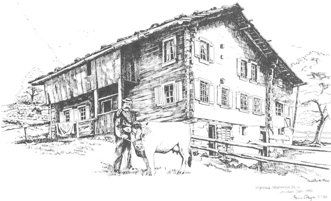
Abb. 2 Das Gross-Stammes-Haus von Nordosten. Die Kreuzigungsdarstellung befand sich an der Aussenwand im Innern der Stube, rechts vom hier sichtbaren östlichen Hauseingang. Nachzeichnung nach einer Fotografie aus dem Jahr 1911 durch Xaver Wyss, Ennetbürgen

die erkennbar bemalte Bohlenpartie auszusägen und im «Tenn» zu deponieren. Als Herr Zimmermann die ihm überlassenen Balken abholte und das Bild wieder zusammensetzen wollte, konnte er den untersten Balken leider nicht mehr finden und ersetzte ihn durch einen andern, der zusätzlich dort als Heizmaterial auf einem Haufen lag. Die vier damals noch etwa 1,5m langen Balken wurden auf ihre heutige Länge von rund 70 cm zurechtgestutzt, nachdem sie von einem Vorstandsmitglied des Historischen Vereins Nidwalden fotografiert worden waren (Abb. 3).