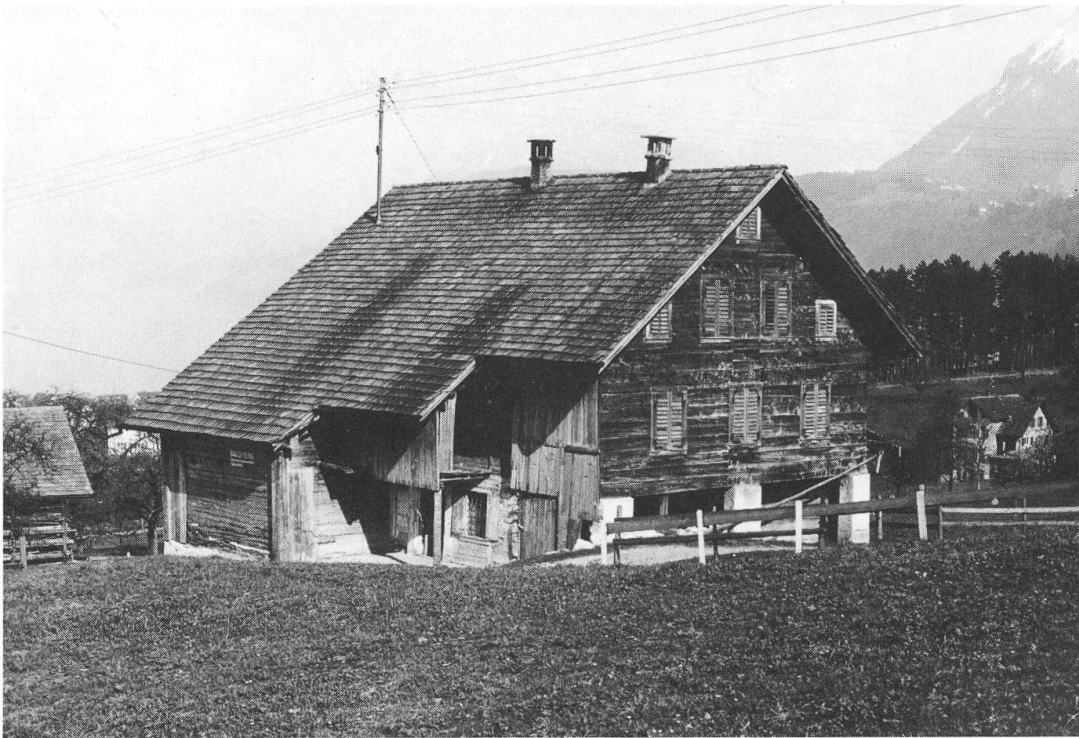
Abb. 1 Das Haus «Gross-Stämes» mit Blick auf die um 1914 unschön erweiterte Südfront und die Westseite samt Hauseingang. Links davon das Schild «Bauleitung». Foto: P. Adelhelm Bünter, April 1969

polizeiliche Verordnung erlassen worden, welche den Krämern während einer Pestzeit das Hausieren verbot 6 .