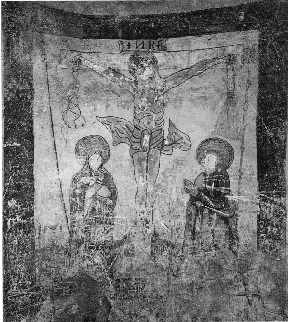
Abb. 5 Spätgotisches Wandgemälde im Rathausturm von Stans.