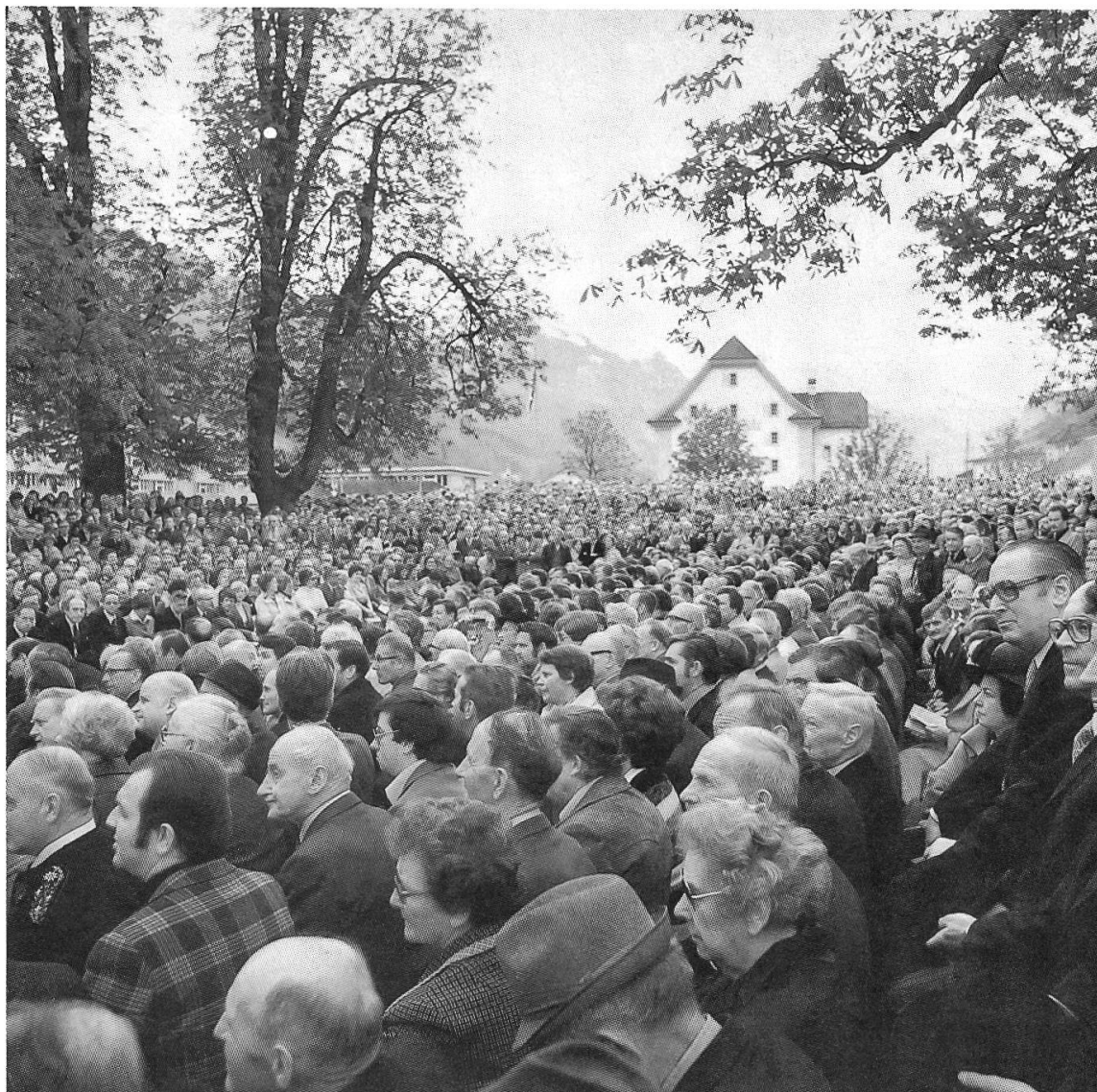
1 Traditionsgemäss versammelt sich die Landsgemeinde bis heute im Ring zu Wil an der Aa.

samt und sonders wieder annulliert wurden 69 . Die Mächtigen kamen auch nicht dadurch ans Ziel, dass sie nach den tumultuarischen Landsgemeinden von 1713 eine lange Reihe von Widerspenstigen bestrafte 70 . Dagegen wurde den Landleuten damit klar, dass sie sich ein grösseres Mass an Rede- und Handlungsfreiheit an der Landsgemeinde nur erringen konnten, wenn auch die Strafkompentenz über allfällige Verfehlungen vor versammeltem Volk an sie überging, was sie nach langem Kampf erreichten 71 .