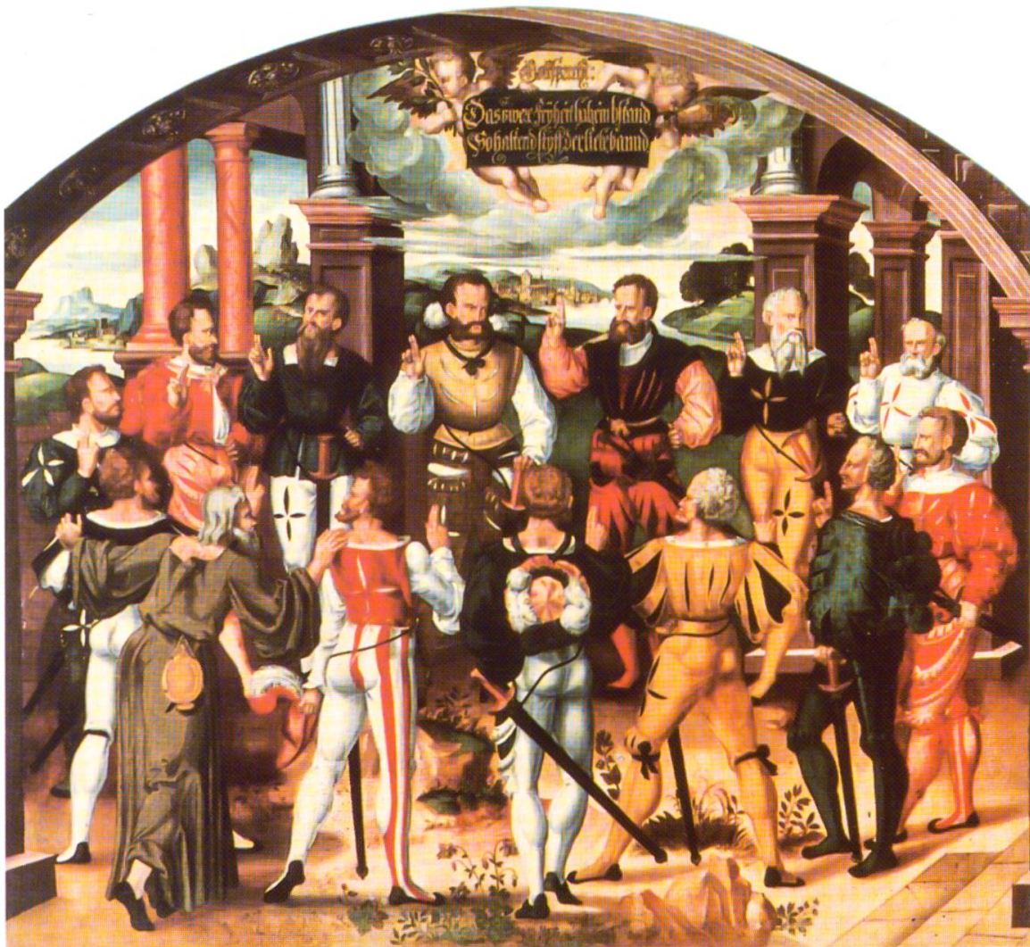
35 Bruder Klaus mahnt zum Bundesschwur. Ölgemälde von Humbert Mareschet, 1584/1586, für das Berner Rathaus, heute im Bernischen Historischen Museum.