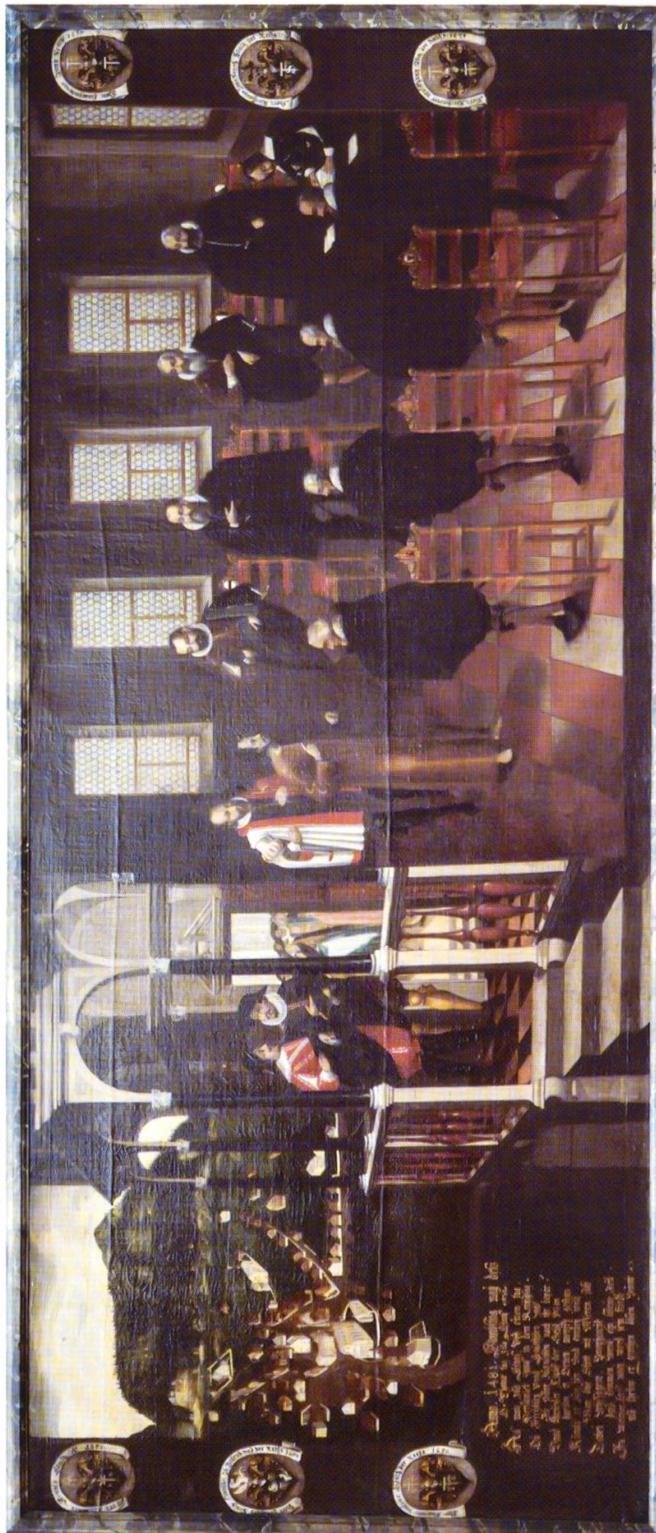
36 Bruder Klaus als Friedensvermittler vor den Tagsatzungsboten in Stans. Ölgemälde von 1650 im Rathaus zu Stans.