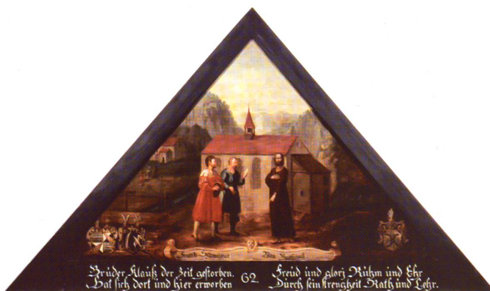
34 Zwei eidgenössische Abgeordnete bei Bruder Klaus. Gemälde im Giebel der Kapellbrücke in Luzern von Hans Heinrich Wegmann, um 1611 (Original 1993 verbrannt).