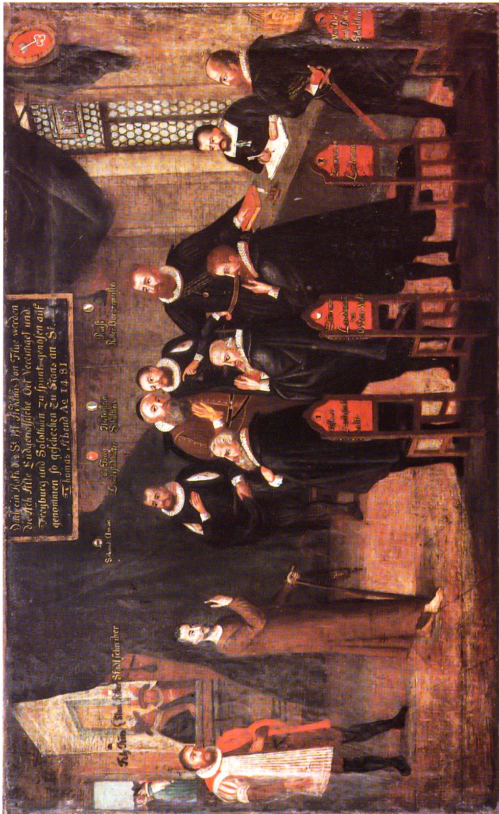
37 Bruder Klaus als Friedensvermittler vor den Tagsatzungsboten in Stans. Replik auf das Stanser Ölbild, 2. Hälfte des 18. Jahrhunderts, heute Sammlung Jean Bruderer, Freiburg.