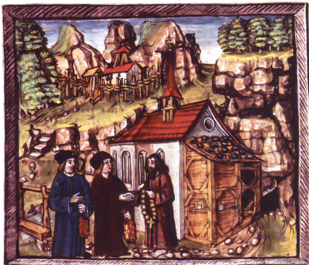
33 Pfarrer Heimo am Grund mit geistlichem Begleiter bei Bruder Klaus. Illustration aus: Schweizer Bilder-Chronik des Luzerner Diebold Schilling.