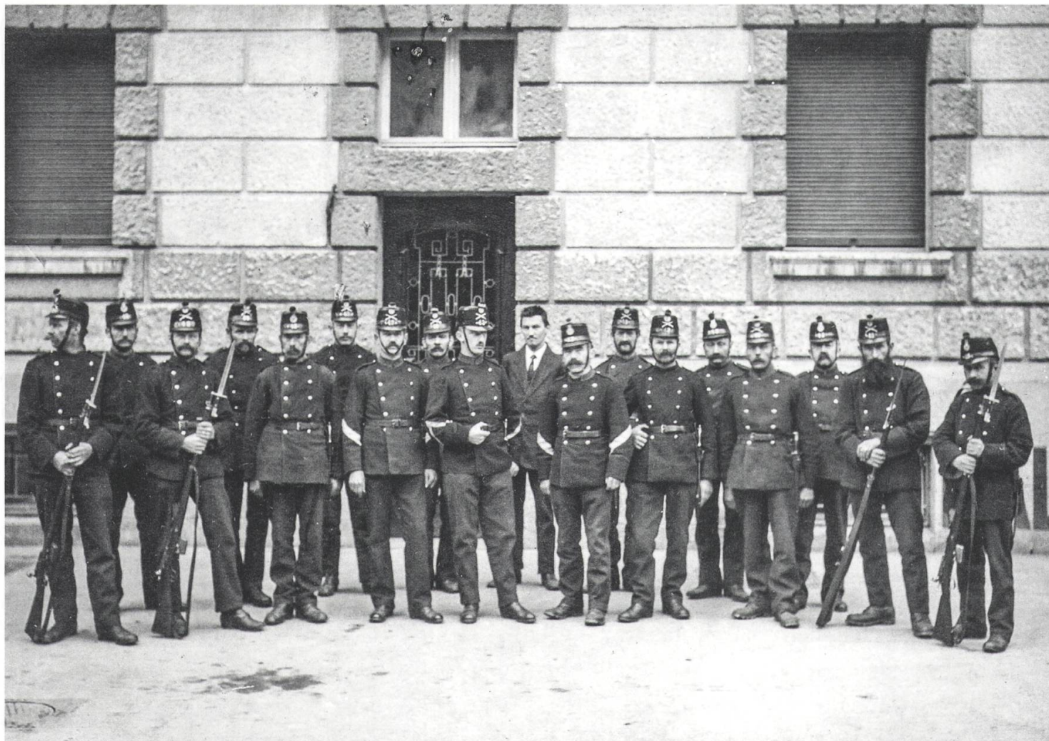
Soldaten des Luzerner Landsturmbataillons 43, die zusammen mit den Ob- und Nidwaldner Soldaten im November 1918 während des Landesstreiks den Ordnungsdienst in der Stadt Luzern versahen.

gebracht. Wer nicht bereit war, die Arbeit wieder aufzunehmen, wurde verhaftet. Um 8 Uhr fuhr der erste Zug, mit einem Ingenieur im Führerstand, in Begleitung einiger Nidwaldner Schützen nach Bern ab. Am folgenden Tag forderte der Bundesrat in einem Ultimatum den Abbruch des Generalstreiks, worauf sich das Oltener Komitee am 14. November frühmorgens fügte und den Ausstand bereits nach zwei Streiktagen abbrach. Die Nidwaldner Schützenkompanie blieb während vier Tagen im und um den Luzerner Bahnhof auf Posten. Nachdem am 15. November das