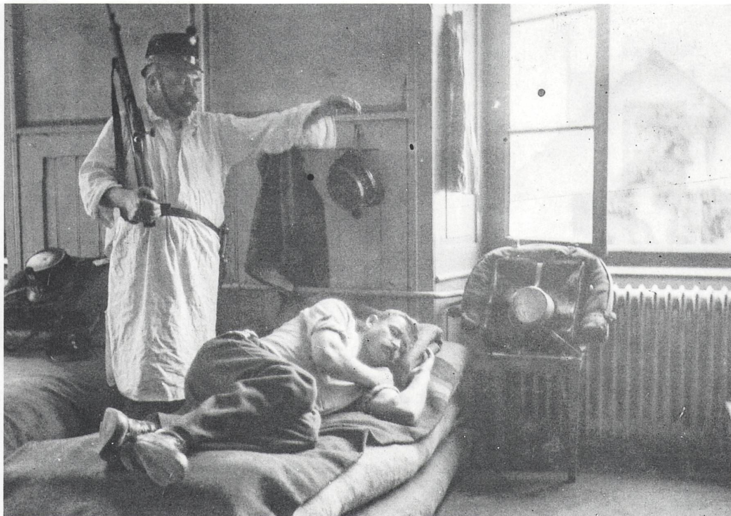
Schabernack von Landsturmsoldaten. Da Landsturmeinheiten vor allem für Bewachungsaufgaben in oder nahe von Ortschaften eingesetzt wurden, waren sie meist komfortabler einquartiert (wie hier in einem heizbaren Schlafsaal) als der Auszug.

Ditschä fürchtä.» 38 Sehr unbeliebt waren die immer gleichen Einzel- und Verbandsausbildungen, «geisttötende Soldatenausbildung» genannt. 39 Motiviert waren die Nidwaldner dagegen bei der Ausbildung an neuen Waffen und Geräten, so bei der Einführung des Infanteriegewehrs 11 und des Karabiners 11, der Handgranate, des Scheinwerfers und des Maschinengewehrs oder bei der Instruktion von neuen Kampfverfahren wie etwa dem Grabenkampf, dem Kampf im Gebirge oder der Fliegerabwehr. Beliebt waren bei den Soldaten «praktische» Einsätze, beispielsweise der Bau