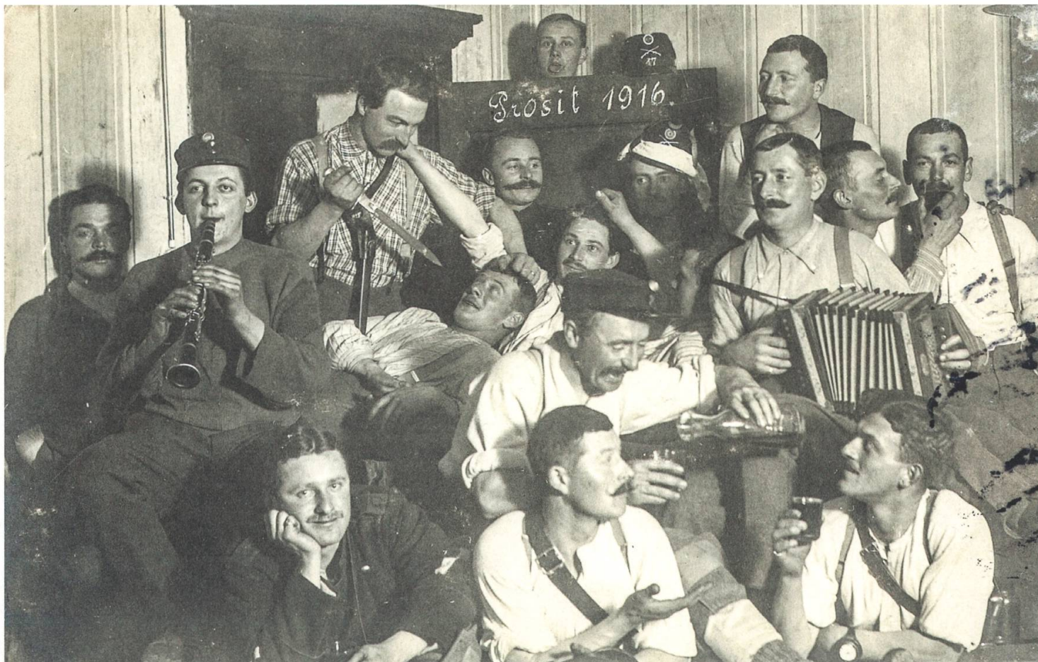
Silvesterfeier 1915/16 der Geb Inf Kp IV/47 in Astano im Tessin, wo die Nidwaldner Auszugsoldaten ab Ende November 1915 an der Tessiner Westgrenze zwischen Lago Maggiore und Luganersee eingesetzt wurden.

zuhaus zu beruhigen und das Vertrauen in die Armee zu stärken, oft auch in Versform: