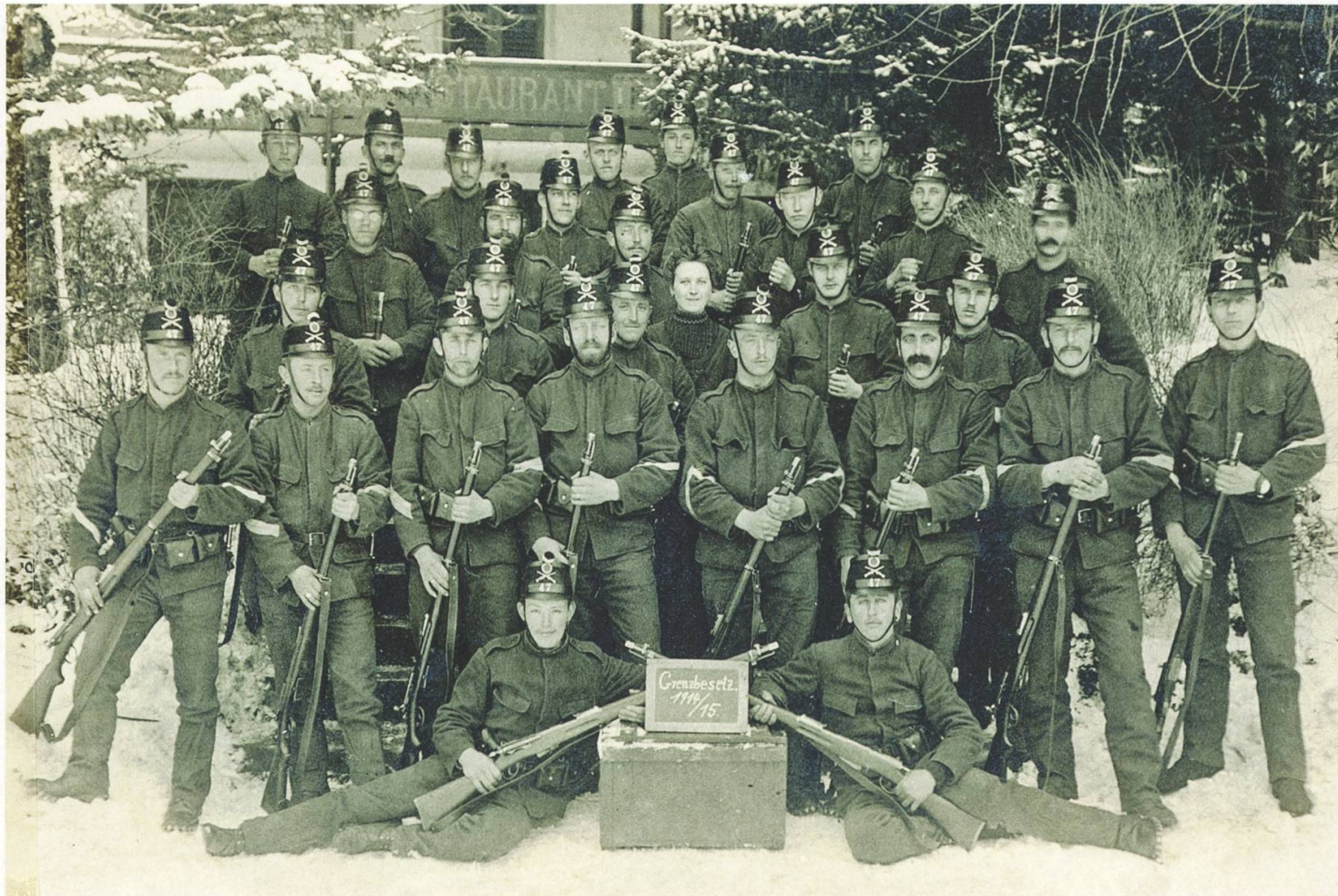
Soldaten der Nidwaldner Geb Inf Kp IV/47 posieren während des ersten Aktivdienstes im winterlichen Langenbruck (BL), Ende Februar/Anfang März 1915.

beobachtet – darauf, dass alle Truppen ungefähr gleich viel Dienst leisteten.