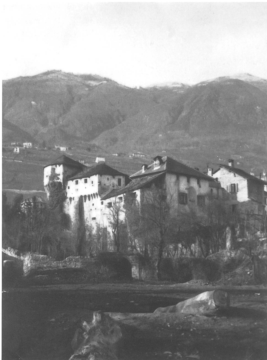
Fig. 1 - Il castello di Locarno come si presentava all'inizio del novecento prima dei lavori di restauro. I Sindacatori dei dodici Cantoni si riunivano in una sala situata al 2° piano.