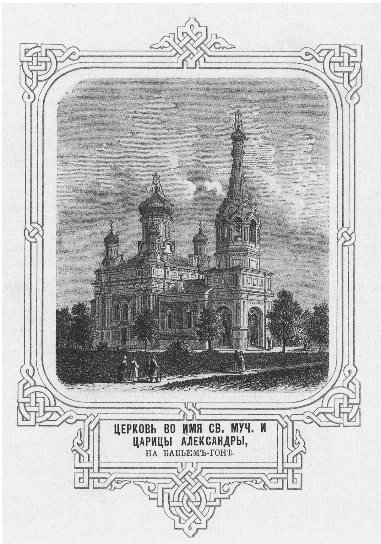
ЦЕРКОВЬ ВО ИМЯ СВ. МУЧ. И ЦАРИЦЫ АЛЕКСАНДРЫ, НА БАБЬЕМЪ-ГОРЬ.

Peterhof. Chiesa della Santa Martire Alessandra sulla collina Babigonje. Estratto da A. Gejrot, Opisanie Petergofa , Sankt Peterburg, 1868. Ristampa 1991.