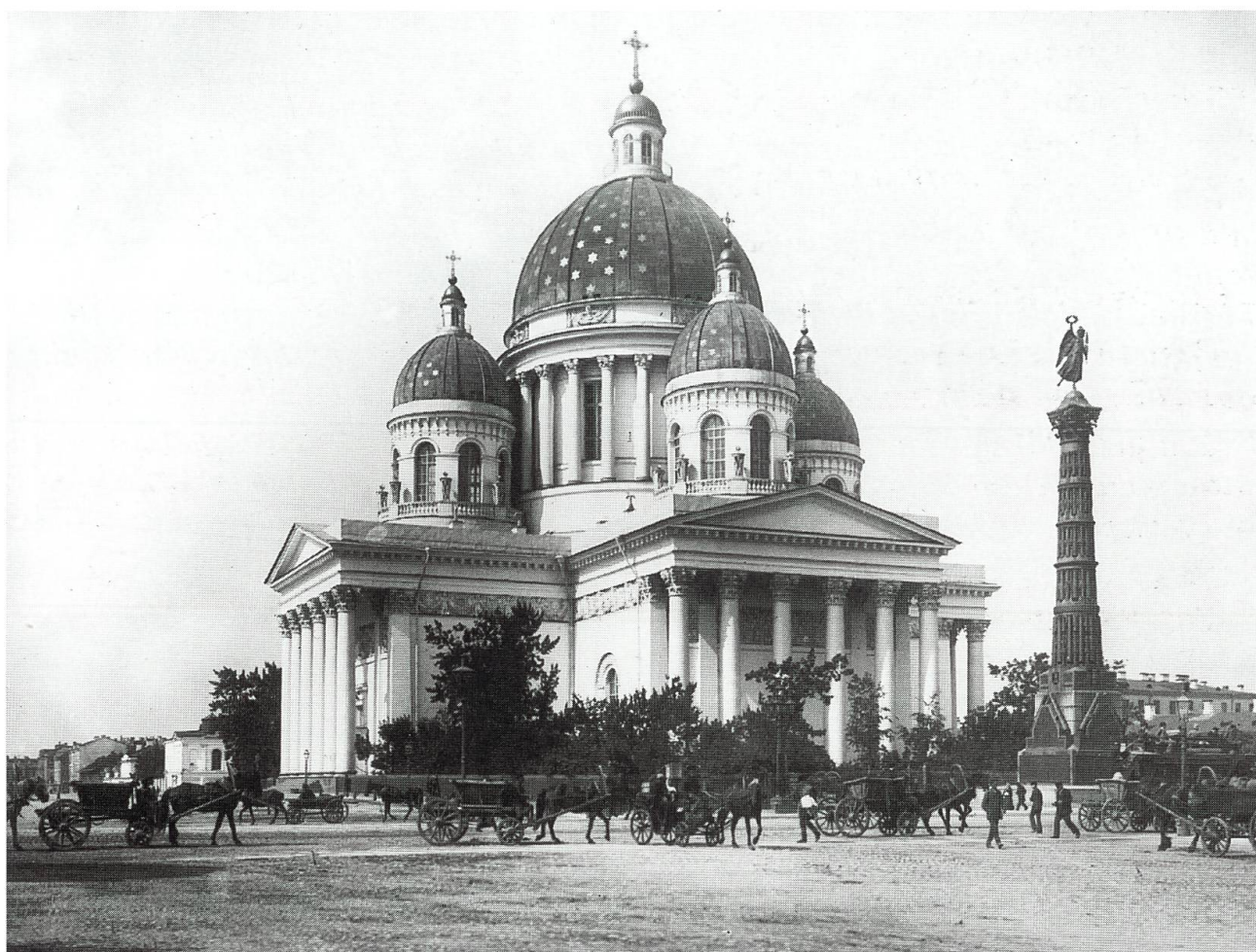
1) La chiesa della Trinità a San Pietroburgo

L'architetto Stasov fu messo agli arresti per 24 ore. Il 18 ottobre 1831 fu terminata la cupola principale. Ma nella notte tra il 22 e il 23 febbraio 1834 ci fu un secondo incidente causato da una violenta bufera che asportò la cupola. Stasov fu arrestato per 10 giorni. La completazione del progetto fu affidata dallo Zar Nicola I all'architetto P.P. Basin ed ai suoi collaboratori: il professore in matematica applicata dell'Istituto delle Vie di comunicazione Maggiore Melnikov, il tenente Buttazzi e l'architetto Alessandro Rusca, che condussero a termine l'incarico in modo perfetto, in meno di 3 mesi. Per la perdita lo Zar risarcì i danni. La consacrazione ebbe luogo il 25 maggio 1835 5 .