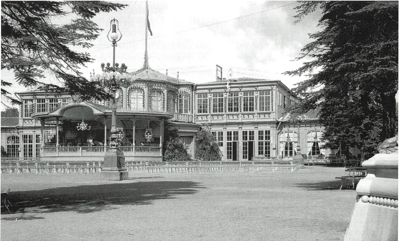
2) Stazione di Pavlovsk