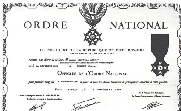
Attilio Bignasca, Diploma di Ufficiale dell'Ordine Nazionale della Repubblica della Costa d'Avorio.

Partecipa con il fratello all'attività politica della Lega dei Ticinesi. Tra il 1991 e il 2015 fa parte del Gran Consiglio ticinese, di cui è presidente nel 2002. Tra il 2003 e il 2009 è in Consiglio nazionale per la Lega. Nel 2013, dopo essersi trasferito da Agno a Lugano, è nominato per tre anni nel Consiglio comunale della Città. Nel 2019 annuncia il suo ritorno in politica ed è di nuovo eletto per il Gran Consiglio ticinese nelle elezioni dell'aprile 2019. Rinuncia alla carica per motivi di salute nel mese di dicembre dello