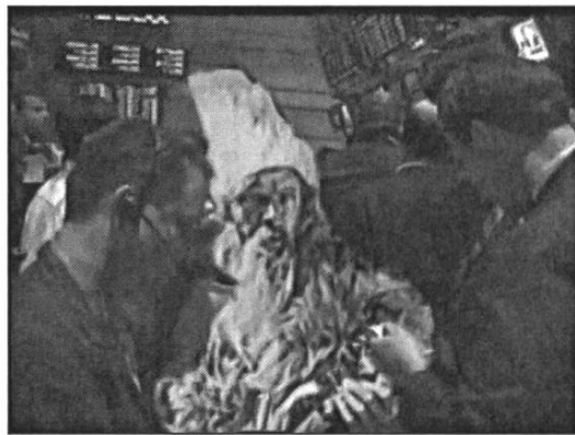
Robinsón en Wall Street ( Aislado , Gerard Freixes, 2007)

En el caso de Freixes, el paratexto colma la curiosidad del receptor aportando informaciones acerca del material utilizado. Aparecen así en los créditos de Aislado , Alone y The Homogenics los títulos de las obras recicladas y los nombres de sus autores; en el último de los cortos, el ansia de precisión lo lleva incluso a detallar el título de los diferentes capítulos de dominio público de The Dick van Dyke Show empleados, y el nombre del guionista de cada capítulo junto al del director. No necesita sin embargo el espectador llegar a esos títulos de crédito para destruir la ilusión realista que apenas ha durado unos segundos: 42, para ser precisos, lo que tarda el primer Dick van Dyke en abrir la puerta al segundo, antes de que se les unan un tercero y hasta un cuarto. Reconociendo o no el metraje apropiado, sin duda nadie puede adherirse a tal proliferación de Dick van Dyke, ni puede dejar de percibir las escasas pero perceptibles infracciones de las reglas de proporción, tamaño y perspectiva.