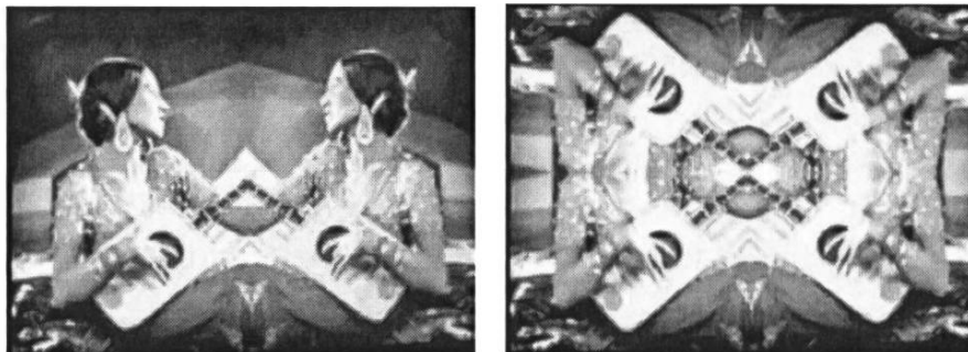
Dos imágenes de Crossing Games (Gerard Freixes, 2008)

Gerard Freixes obra de una manera radical en cortos que se sustentan únicamente en viejas imágenes televisivas y cinematográficas sobre las que ejerce una evidente manipulación 14 . En Crossing games (2008) el realizador catalán construye un acompañamiento visual a la música de Bernat Roca, a base de imágenes recuperadas del acervo hollywoodiense y que, en tanto que especulares y caleidoscópicas, recuerdan a las que inundan la obra del experimentador belga Nicolas Provost. Se inscribe este trabajo en la tradición menos crítica del apropiacionismo, la que dialoga con el centro por excelencia de la cultura popular, estilizando unas imágenes ya de por sí estilizadas, que se liberan ahora de toda tiranía narrativa y reivindican su naturaleza de objeto estético y kitsch 15 . Ese diálogo con la cultura más popular será una constante en la obra de Freixes, aunque veremos a continuación que normalmente se establece una relación más compleja entre el objeto encontrado y la pieza que se crea a partir de éste.