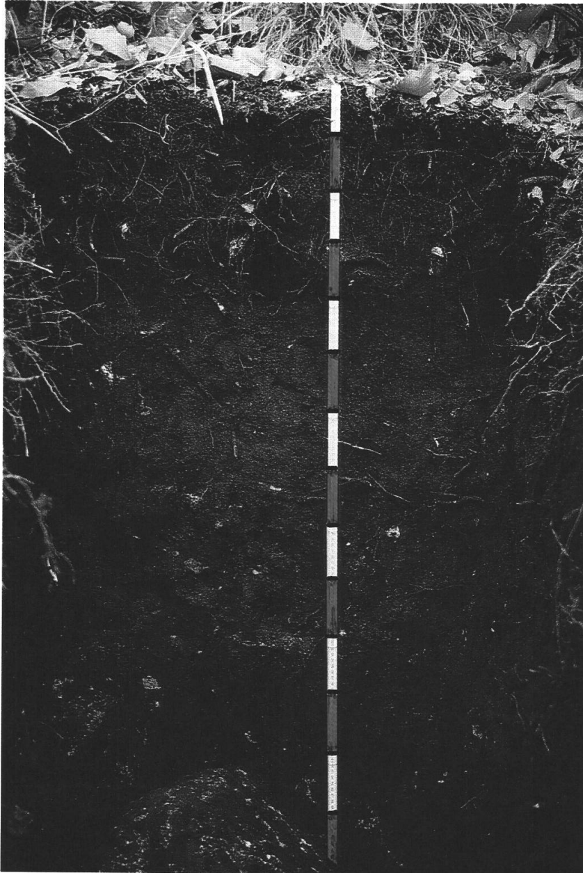
Abb. 1. Bodenprofil. Aufgrund von Charakterisierungsmerkmalen und chemischen Analysen als Kryptopodsol zu bezeichnen (Blaser 1973). Die Markierungen auf dem Doppelmeter betragen jeweils 10 cm. Weitere Angaben im Text.

Ob die Holzkohlen in Stamm, Borke, Zweigen oder Wurzeln lokalisiert waren, lässt sich in genügend großen Fragmenten auf Grund anatomischer Differenzierungsmerkmale in den verschiedenen Pflanzenorganen nachweisen. Stamm- und Astholz ist holzanatomisch in den wenigsten Fällen mit absoluter Sicherheit unterscheidbar: Der Krümmungsradius von Jahrringen kann Hinweise liefern, da dieser in den meist dünneren Ästen größer ist als in dickeren Stämmen. In kernnahen Stammregionen und bei jungen Bäumen jedoch versagt dieses Vorgehen. Wo in Tab. 1 nicht anders vermerkt, kann es sich sowohl um Stamm- wie auch um Astholz handeln (s. Diskussion).