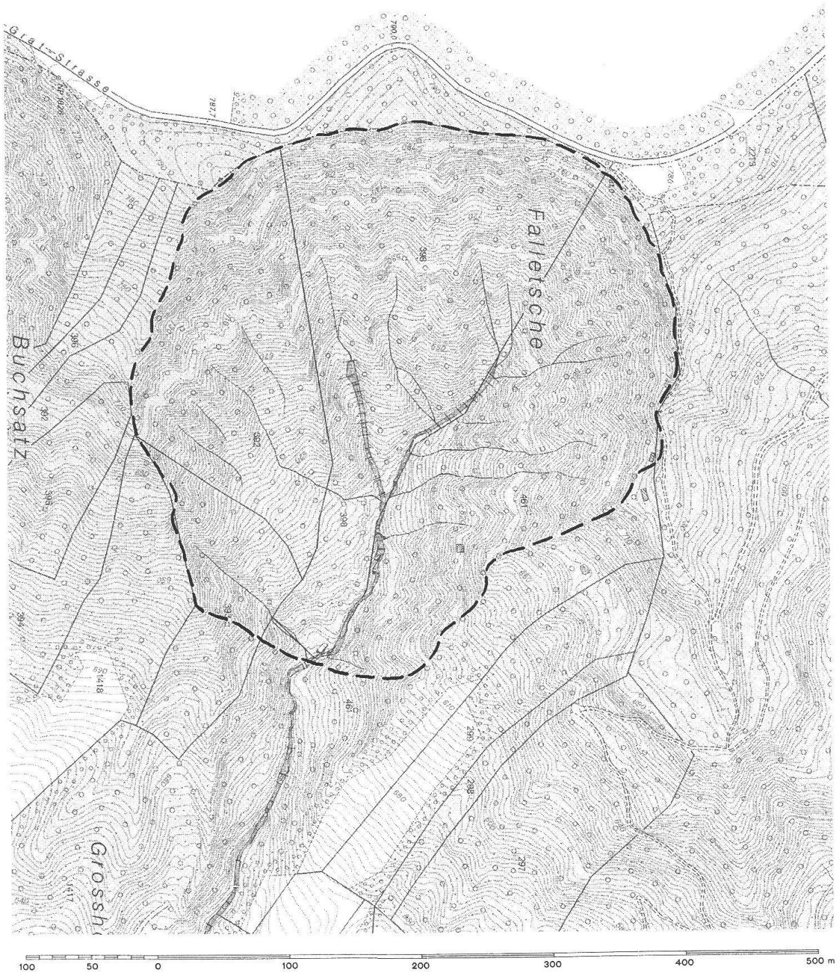
Fig. 1. Karte der Fallätsche (Maßstab 1 : 5000; Äquidistanz der Höhenlinien: 2 m; reproduziert mit Bewilligung des Vermessungsamtes der Stadt Zürich vom 15. 3. 1996) und Umgrenzung (gestrichelt) des Untersuchungsgebiets.