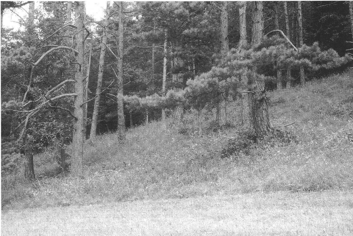
Abb. 2. Lichter Waldrand (Fläche R-b, Juli 2000): Im neunten Sommer nach Entbuschung und nach sechsmaliger Folgepflege scheint der Unterwuchs gebüschfrei, die Gehölze nehmen jedoch infolge Stockausschlags noch immer rund 10% Deckung ein.

Die ideale Jahreszeit für Pflegeeingriffe, um Gehölze am meisten zu schädigen, mag je nach Art und Jahreswitterung unterschiedlich sein; am schonendsten ist der Winterschnitt, was Ducrey und Turrel (1992) bei der Steineiche an Sprosszahl, -grösse und -durchmesser des nachfolgenden Stockausschlags zeigen. Der schädlichste Schnitt erfolgt während der Hauptwachstumsphase im Frühling. So empfehlen z.B. Schumacher et al. (1995) eine regelmässige frühe Mahd. Ein zweiter Schnitt im Juni oder September verhilft möglicherweise zu einem noch rascheren Rückgang der Sträucher (Wilmanns 1989, Kollmann und Staub 1995), da die Nährstoffreserven im Wurzelsystem aufgebraucht werden. Allerdings sind mit dem mehrmaligen Schnitt negative Auswirkungen auf die Magerwiesenarten nicht auszuschliessen.