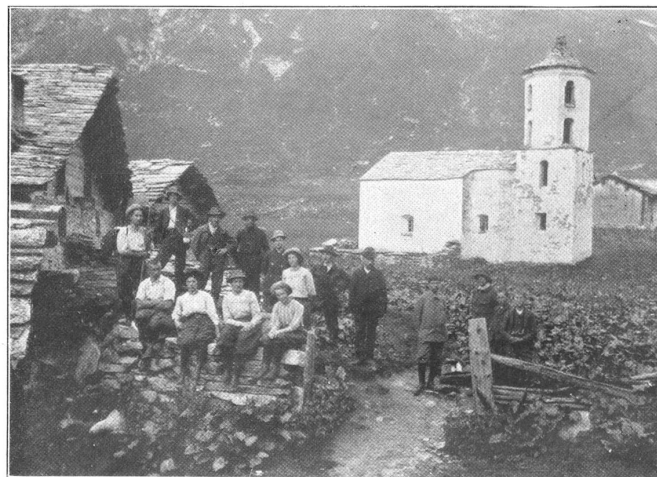
26. Juli 1910. In Zervreila (Vals). Herrlich hat der Morgenkakao ge- schmeckt. Jetzt muß bald der Rucksack wieder aufgenommen werden! Aber vorher wird die liebliche Alp noch photographiert. Zu äußerst rechts stehen die zwei Hüterbuben, die allein die verlassenen Hütten hier oben bewohnten und junges Vieh hüteten. Sie zeigten uns einen Gaden mit Heu zum Schlafen und läuteten uns die Glocken des hei- meligen Kirchleins zur Abendzeit.

Ja, wandert auf die einsame Alp, wandert wohl über die Berge, wohl durch das tiefe Tal. In Wald und