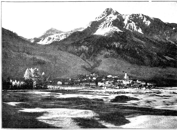
S P L U G E N

in der Kirche zu Großenlinden, das öffentliche Glaubensexamen einer Taubstummen, die Konfirmation mit folgender Abendmahlsfeier. Die Sache ist so unerhört, daß auch die „Hessens-Darmstädtische privilegierte Landeszeitung“ ausführlich davon Notiz nimmt. Ihr folgen wir, wenn wir berichten: „Heute ist die Confirmationshandlung des taubstummen Fräuleins von T... aus Chur, die schon in Nro. 48 der L. Z. angekündigt worden, durch Herr Pfr. Arnoldi in Großenlinden vollzogen worden. Viele angesehenen Personen, besonders aus Gießen und Wetzlar, waren zugegen, und alles fand seine Erwartungen übertraffen... Mit Unerschrockenheit und heiligem Anstand trat die Fräulein vor den Altar und mit gleicher Unerschrockenheit und gleichem Anstand erteilte sie auf alle Fragen die treffendsten Antworten. Wie sie mit warmer Ueberzeugung ihr Bekenntnis ablegte und sich vor den Altar hinwarf, den Segen zu empfangen, konnte niemand, auch nicht der Hartherzigste, die Tränen zurückhalten.“