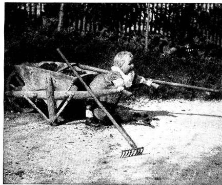
„IM SCHWEISSE DEINES ANGESICHTS“