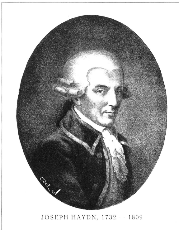
JOSEPH HAYDN, 1732 - 1809

Es sollen hier weder seine Werke aufgezählt noch besprochen werden. Es sei vielmehr zum Schluß noch der Versuch gemacht, die wesentlichen Charakterzüge seiner Persönlichkeit und die Wirkungen seiner Musik kurz zu umschreiben. Von den drei großen Klassikern der Musik, die um die Wende des 18. zum 19. Jahrhundert von Wien, der musikalischen Kaiserstadt aus, der europäischen Musik auf fast allen Gebieten einen unvergleichlichen Anstoß gaben, ist Joseph Haydn vielleicht derjenige, der in weitesten Kreisen der Musikfreunde am bekanntesten, beliebtesten und am meisten verstanden ist. Die gewaltige Größe eines Beethoven, sein feuriges Temperament, die Tiefe seiner musikalischen Ein-