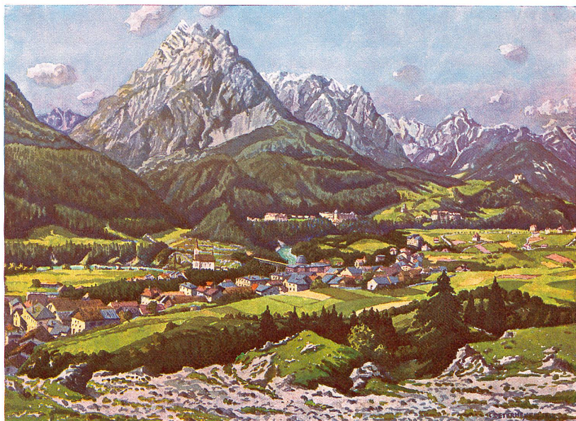
Aquarell von Carl Determeyer