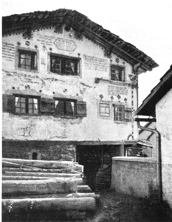
Das alte Pfarrhaus von Präz