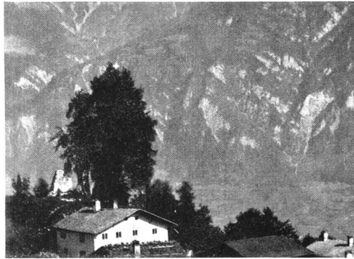
Altes Pfarrhaus von Portein und Kirchenruine St. Gallus