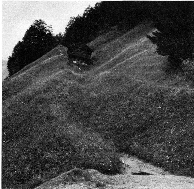
Rutschung bei Schuders. Aufnahme vom 12. Juli 1941

tretenden Sohlenvertiefung unterhalb der Landquart-Mündung auf die angrenzende Anschlußstrecke oberhalb der Landquart.