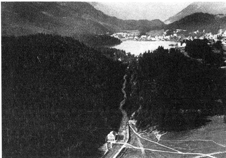
St. Moritzersee, Innschlucht. Links die neue Zentrale Islas. Rechts die frühere private Zentrale des Kulm-Hotels.

Verschiedene Symptome veranlaßten im Jahre 1950 die Betriebsleitung, eine gründliche Revision der Kraftwerkanlagen vorzunehmen. Die Kosten der Erneuerung kamen gesamthaft auf zirka 85 000 Franken zu ste-