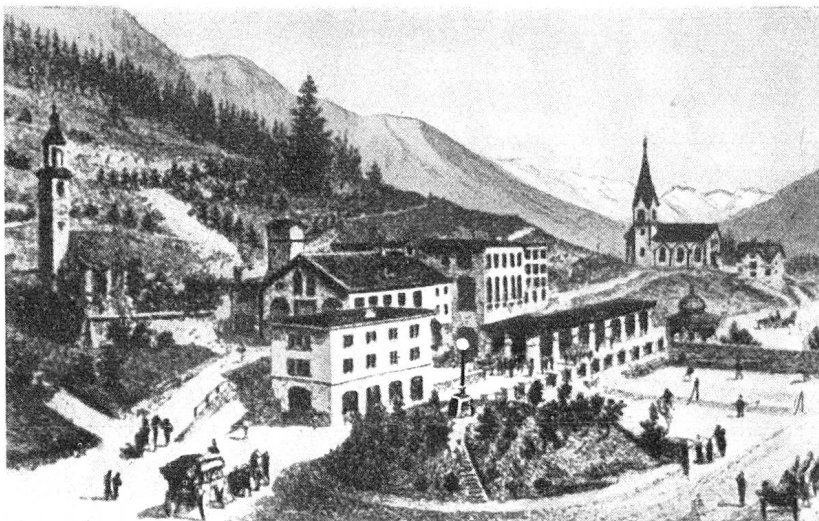
Oekonomiegebäude des Kulms, auf dem Hügel die 1878 errichtete Bogenlampe. Links die alte evang. Kirche mit dem schiefen Turm. Rechts die kath. Kirche.

Ging es bei dieser Ausmarchung mehr um Behauptung der Selbständigkeit, so begann nun ein neues Ringen, diesmal um den materiellen Grundstoff, das Wasser. Mit dem Projekt der Bergeller Kraftwerke beabsichtigte man, den Silsersee als Staubecken zu benützen und dessen Speicherwasser westwärts ins Bergell zu leiten. Eng verbunden mit allen Naturfreunden in der ganzen Schweiz, setzten sich die an den Wasserrechten des Engadins interessierten Gemeinden tatkräftig und unermüdlich zur Wehr, bis am 13. Februar 1934 der Kleine Rat verfügte, daß an der bisherigen Ordnung nichts geändert werden dürfe, wonach die Abflußrichtung der Gewässer im Oberengadin so, wie es die Natur bestimmt habe, auch in Zukunft nach Osten bleiben solle.