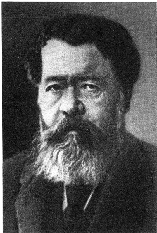
JOHANN BADRUTT der Gründer des Winter-Kurorts St. Moritz und Erbauer des ersten Elektrizitätswerkes in der Schweiz, 1819—1889

Im Jahre 1878 besuchte Johannes Badrutt, der Gründer des Kulm-Hotels und eifrige Förderer der Wintersportinteressen des Kurortes St. Moritz, die Weltausstellung in Paris. Er sah dort die erste elektrische Beleuchtungsanlage und erkannte intuitiv die große Bedeutung dieses Lichtes und dessen Verwendungsmöglichkeiten für unsere Hotellerie. Sofort machte er sich ans Werk. Unter Ausnützung der Wasserkraft des nahen Brattasbaches ließ er in seiner Schreinerei durch die Firma Stirnemann, Zürich, ein kleines Kraftwerk und eine elektrische Beleuchtungsanlage, System Jablochkoff, mit einem Kostenaufwand von zirka Fr. 11 000.— erstellen. An Weihnachten 1878 erstrahlten erstmals im Speisesaal