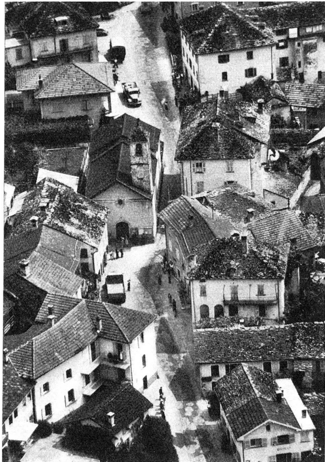
Die Kirche bleibt

Um den Rundgang im Sektor des Bauwesens abzuschließen, darf die