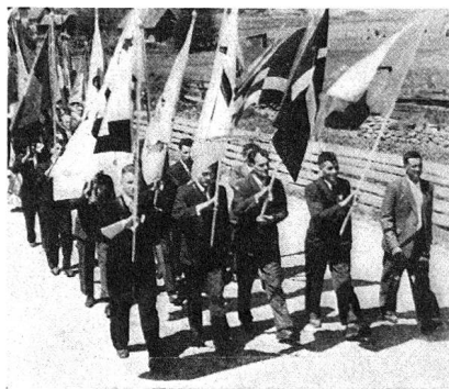
Umzug. Die Fahnen

Oft sind die Zuschauer bei einem Festzug vorwiegend mit Warten beschäftigt — Warten auf den Beginn, Warten auf die nächste Gruppe, Warten auf den Schluß. Nicht so bei dem mustergültigen Umzug, der das Nachmittagsprogramm der Feasta da Schons einleitete. Er begann zur festgesetzten Zeit, und die bunten Gruppen zu Fuß, zu Roß und per Fuhrwerk lösten sich