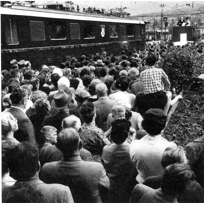
Die neue Lokomotive «Graubünden» auf dem Bahnhof Chur 1958.

Beim Überblick über eine solche Chronik muß einem auffallen, daß unsere Künstler, im Vergleich zu ihren Kollegen in anderen Kantonen oder gar im Ausland, in Deutschbünden eigentlich recht stiefmütterlich behandelt werden. Nicht, daß ihnen die Anerkennung für ihr Werk fehlte. Gemeint sind die Poeten, Musiker und Maler und Bildhauer. Aber irgendwie sollten sie doch auch materiell unterstützt werden. Dem Chronisten schwebt so irgendwie ein «Kulturfonds» vor, aus dem, wie z. B. in Zürich, jungen, strebsamen Künstlern ein Stipendium, eine klingende Anerkennung dargebracht werden könnte. Und dann, um mit Lessing zu sprechen: «Wir wollen weniger erhoben und fleißiger gelesen sein»: unsere Dichter kommen kaum in die Lage, einmal aufgeführt zu werden, falls sie sich mit der dramatischen Kunst in Mundart oder Schriftsprache befassen. Noch immer spielen unsere Dorfmime mit Vorliebe fremde Stücke und verkennen oft das einheimische Gewächs, das nicht gedeihen wird, wenn es doch nicht an die Sonne gelangt. Vielleicht sollte dieses Anliegen einmal ernsthaft erwogen werden. Karl Lendi , Chur