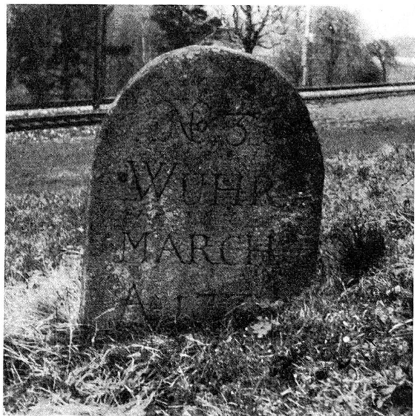
Wuhr- oder Rheinmarch Nähe der Station Haldenstein östlich der SBB. Der sehr schöne Markstein bildete einen Fixpunkt, von dem aus eine bestimmte Anzahl Klafter (2,10 m) rheinwärts gemessen, die eigentliche Grenzlinie zwischen Chur und Haldenstein verlief.

Hier soll Baldiron nach den Aufzeichnungen von Salis angesichts des erbitterten Kampfes die Äußerung getan haben: «Die Pünter sind nit menschen, sondern taiffel, und hät' ich deren fünf tausend, ich wollt den Grafen Mansfeld bald aus dem Elsaß vertrieben habn. Wir