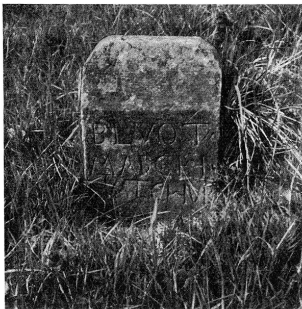
Blutmarch, Grenzstein zwischen den Hochgerichten Chur und IV Dörfer, steht seit 1684 wenige Meter westlich der Landstraße außerhalb der Halbmil.

Haldenstein bildete zu allen Zeiten in geo-graphischer wie politischer und rechtlicher Hinsicht einen Fall für sich.