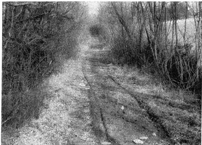
Eingewachsene Partie der alten „Reichsstraße“ nördlich der Molinära bei Trimmis, aus der Zeit vor dem Straßenbau 1782-1786.