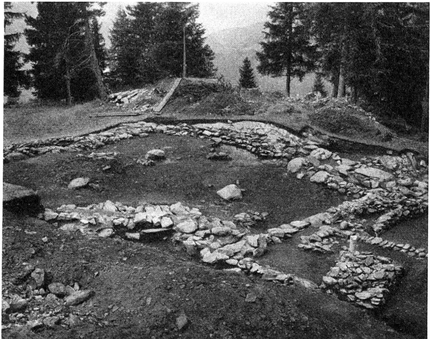
Abb. 6. Das «Herrenhaus» der jüngeren Eisenzeit, von Osten, rechts Eingang, in der Mitte vorn die Hausecke des jüngeren Melaunerhauses.

Bronzezeit anschließt und also noch deren letzte Phase umfaßt.