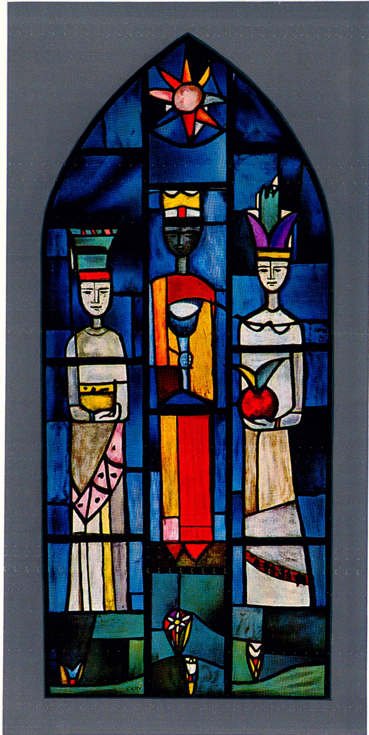
Gian Casty: Dreikönigs-Fenster, 120 x 260 cm, St. Luziuskirche in Zuoz