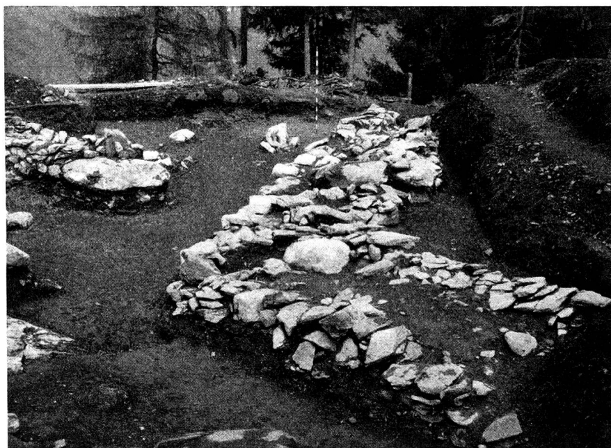
Abb. 4. Hallstattzeitliche Fausecke des jüngeren Melaunerhorizontes.

Die Melaunerkultur dauerte ungefähr von 1200–500/400 v. Chr. In diese Zeit fällt die erste Gewinnung und Verwendung des Eisens. Wann dieses neue Metall in unseren Gegenden in Gebrauch kam, ist schwer zu sagen. Die Wissenschaft läßt heute die sogenannte ältere Eisen- oder Hallstattzeit, so genannt nach dem Fundort Hallstatt, im Hinterland von Salzburg gelegen, mit seinem Salzberg, den man schon