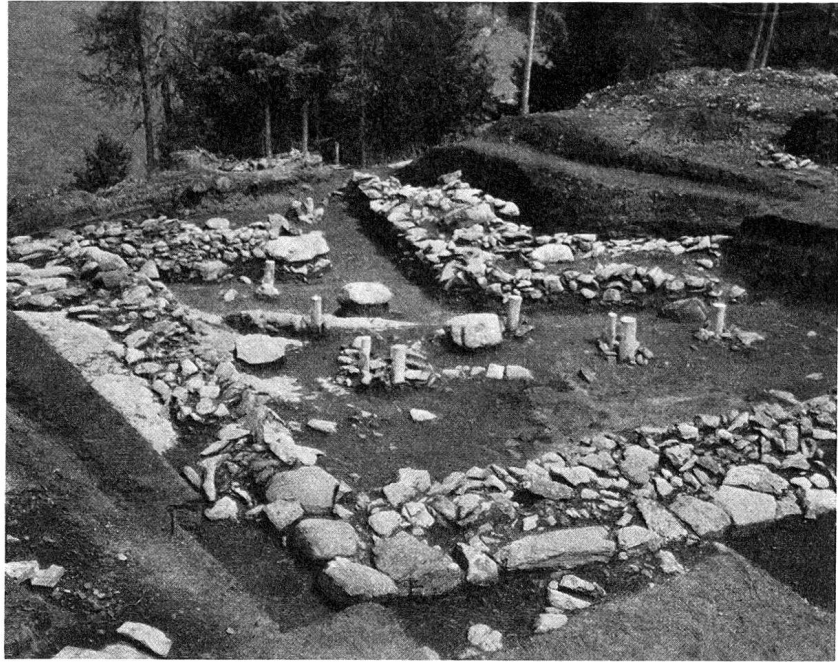
Abb. 5. Südwestecke des «Herrenhauses», Pfostenstellungen des ältern und im Hintergrund Ecke des jüngeren Melaunerhauses.