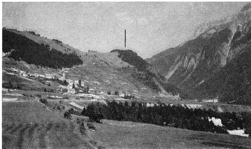
Abb. 1. Die Mottata bei Ramosch, von Westen gesehen.

Bronze (Sicheln, Lanzen spitzen, Kurzschertern, Beilen und Schmuck verschiedenster Art) betrachtet werden darf, hatte sich auf einheimischer Grundlage die Hügelgräberkultur der Hochbronzezeit gebildet, die sich vom 16. vorchristlichen Jahrhundert an das Gebiet vom Böhmerwald bis nach Ostfrankreich eroberte. Die Uferdörfer standen seit ihrem Aufblühen leer. «Statt dessen beginnt die alte Frühbronzezeitbevölkerung die inneralpinen Täler bis gegen die Pässe hinauf zu besiedeln. Im Alpenrheintal, im Bündner Land, im Wallis herrscht