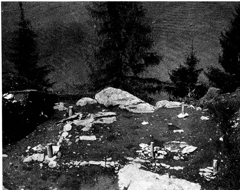
Abb. 2. Grundriß des Hauses der mittleren Bronzezeit, von Süden. Im Vordergrund, von der Bildmitte etwas nach rechts verschoben, die doppelte Herdstelle mit dem Pflock an der Stelle des einstigen Herdgalgens.

schön verzierten Sichelgriff aus Hirschhorn und eine Bronzenadel mit etwas geschwollenem, durchlochtem Hals. Die eher grob gearbeitete Keramik zeigt aufgesetzte Leisten, verziert durch Eindrücke von Fingerspitzen, Fingernägeln und kantigen Werkzeugen. Die Randstücke tragen ähnliche Verzierungen. Ein Fingerbandhenkel mit Schneppe, nach der typischen Form der Ansa-lunata aus den Terramaren Oberitaliens gearbeitet, weist auf Beziehungen mit dem Süden hin. Schon die