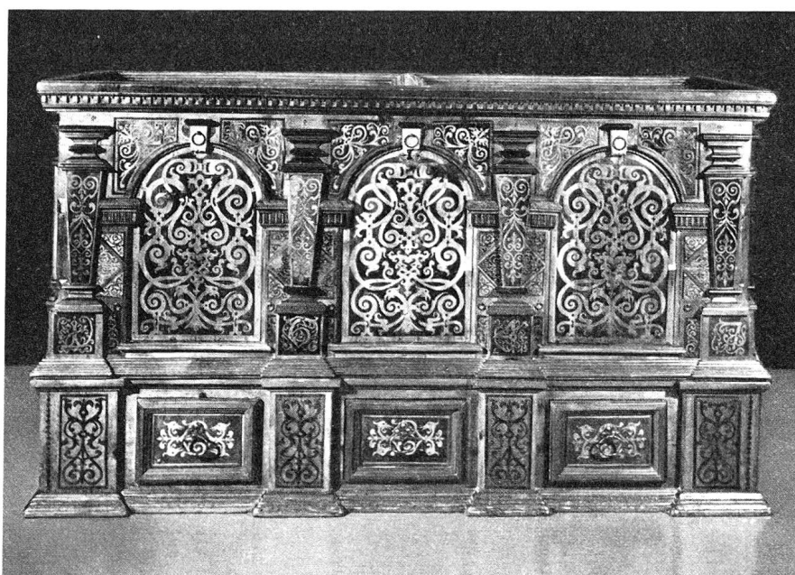
Engadiner Arvenholztruhe aus dem Jahre 1647. Sie besteht aus 2 Teilen, dem oberen Teil und dem Sockel mit drei Schubladen. Maße: Länge 170 cm, Höhe 100 cm, Tiefe 70 cm.

Während der Renaissance verwendeten die Tischler vor allem für das städtische Bürgerhaus zur Verzierung der Truhenfüllungen ein flächenfüllendes Rankenwerk. Als Vorlage dienten Schablonen. Diese kunstvollen Intarsien, wie man die Einlegearbeiten bezeichnet, finden heute mehr denn je unsere Bewunde-