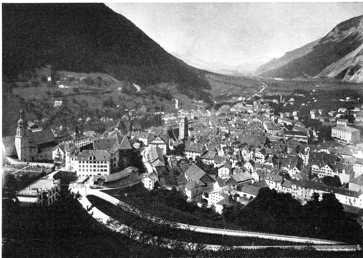
Chur um 1880

Mit dem Wachstum der Stadt ist der Verwaltungsapparat mit der Zeit immer größer geworden. Er hat denn auch längst nicht mehr im Rathaus Platz, sondern ist heute in mehreren anderen Amtsgebäuden und sogar in Mietlokalitäten untergebracht. Das Zentrum der städtischen Verwaltung blieb jedoch im Rathaus, und dieses selbst hat in den letzten