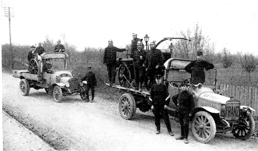
Die erste motorisierte Feuerwehrspritze der Stadt nach ihrem Einsatz anlässlich des Brandfalles in Obersaxen vom 8. November 1915.

f) Polizei- und Feuerwehrwesen. Der Personalbestand war an Polizisten 1884 etwa 4 bis 5 Mann; dazu funktionierten noch einige