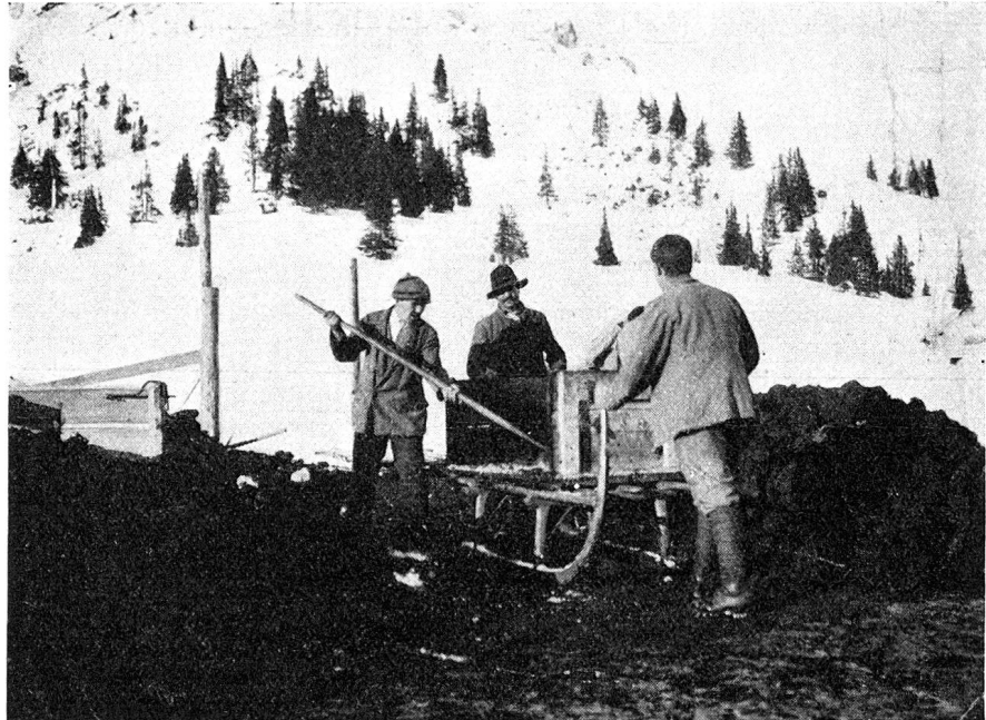
Torf ausbeute auf Brambrüesch während des ersten Weltkrieges.

schwankend, je nach Konjunktur auf dem Holzmarkt, letztere stets mehr oder weniger ansteigend. Wahllos aus einigen städtischen Jahresrechnungen herausgegriffen, ergeben sich