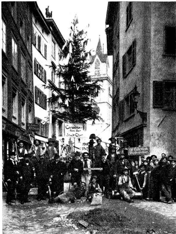
Die Erstellung der Kanalisation in den Jahren 1905-1907 erforderte namentlich in der Altstadt große bauliche Umtriebe.

Im Jahre 1922 hat auch die Feuerbestattung Eingang gefunden. Seit dieser Zeit haben 2112 Kremationen stattgefunden, wovon aber 1096 Auswärtige waren. Die Anlagekosten samt einem späteren elektrischen Ofen beliefen sich auf 380 000 Franken. Das Land gehört der Stadt; es ist das ehemalige «Totengut». Die bauliche Anlage ist Eigentum des Feuerbestattungsvereins. Die Kosten der Kremation waren in den ersten Jahren für Nichtmitglieder hoch; die Stadt zahlte nur 25 Franken Beitrag (die Erdbestattungen inklusive Sarg sind für Einwohner kostenlos). Jetzt bezahlt sie einen Beitrag von 70 Franken, an die Heizung 8 Fran-