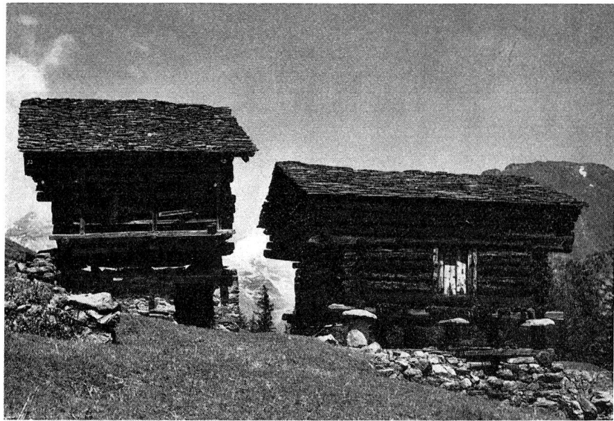
In Gressoney - St. Jean. Ähnliche «Füßchen»-Speicher findet man auch im Wallis und — heute allerdings nur noch selten — im Davoser Unterschnitt

die Tuchhändler daheim, die später blühende Geschäfte in der deutschen Schweiz und in Süddeutschland besaßen, so in Zürich, Winterthur, Goßau, Weinfelden, Bischofszell, Frauenfeld, St. Gallen, Luzern, Konstanz und Lindau, sogar in Kempten und Augsburg. Es war eine ganz ähnliche Auswanderung wie die der Engadiner Zuckerbäcker und Kaffeewirte nach Italien. Die Ausgewanderten zogen immer wieder Leute aus der Heimat nach als Verkäufer, Bürogehilfen und Reisende. Die