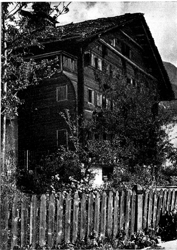
Altes Walserhaus in Macugnaga , durch die Behörden unter Denkmalschutz gestellt.

Col d'Orchetta. Wir folgten dem auf der Karte eingezeichneten Weg und erreichten ohne Mühe die Paßhöhe, von wo aus der Pfad deutlich bis zu einer Alp zu erkennen war. Offenbar aber lag diese seit ein paar Jahren brach, und daher verlor sich die Wegspur bald im Buschwald. Nach einem beschwerlichen Abstieg durch dichtes Gestrüpp erreichten wir unten fast am Bache den Weg, der uns dann nach Bannio und weiter nach Pontegrande führte, und von dort fuhren wir im Auto nach Macugnaga .