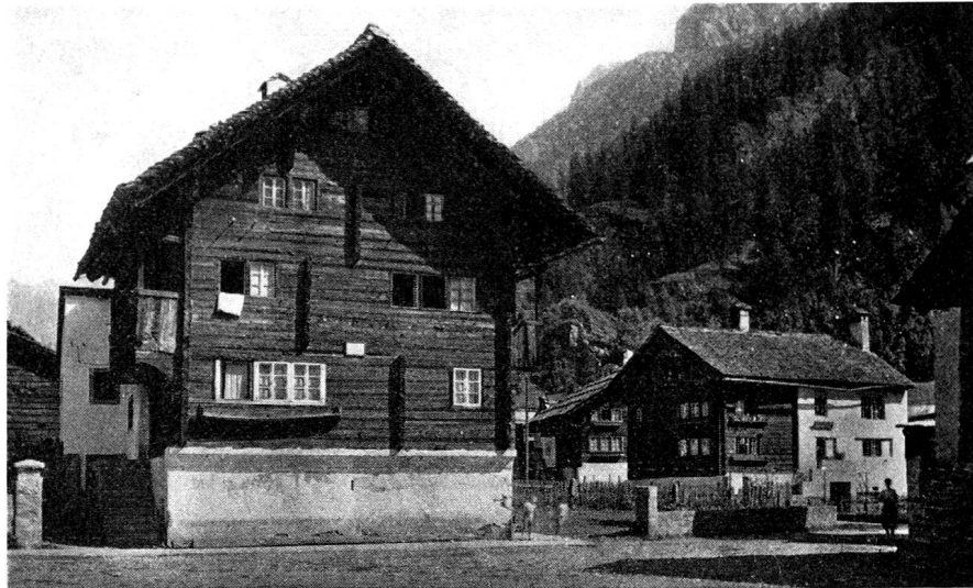
Häuser in Walliser Bauart in Ponte/Steg, Pomat

daran geknüpft, daß der Kanton auch seiner sprachlichen Minderheit, eben den Gurinern, gerecht werde. Vorher hatte der Deutsche Sprachverein der Schweiz die Kosten des Deutschunterrichtes getragen und auch die nötigen Lehrmittel zur Verfügung gestellt. Heute wird diesem während der acht Monate dauernden Schulzeit täglich eine Stunde eingeräumt.