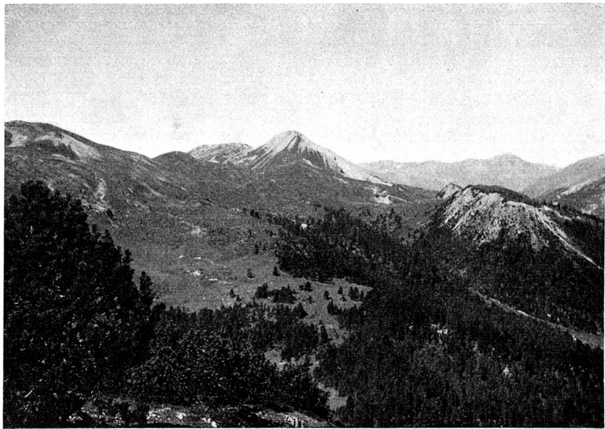
Arvenwald bei Buffalora

Eine vom Rohboden ausgehende Serie der Vegetationsentwicklung verursachte der Fuornbach. Er hat im Laufe von 500 bis 1000 Jahren insgesamt 5 bis 6 Terrassen geschaffen. Auf der untersten, jüngsten Terrasse, die heute noch gelegentlich überschwemmt wird, wurzeln als Erstbesiedler die Alpenpestwurz und ihre spärlichen Begleitpflanzen im Dolomit-Kalkschutt-Rohboden. Eine Stufe höher, wo der Schutt stellenweise bereits von etwas Humus durchsetzt ist, breiten sich Silberwurzspaliere oder, wenn der Schutt fein ist, das trockenheitliebende Erdmoos Tortella inclinata rasenförmig aus. Auf der dritten, humusreicheren Terrasse, deren Alter auf 50 bis 150 Jahre geschätzt wird, sind die Silberwurzspaliere bereits von zahlreichen 5 bis 50 cm hohen Bergföhren durchsetzt. Eine weitere Stufe höher aber sind die Bergföhren schon zu Bäumen emporgewachsen, und zu ihren Füßen haben die Erika und die Niedrige Segge die Silberwurz verdrängt. Auf der fünften Terrasse und darüber zeigt der Boden eine sogenannte Möraufgabe d. h. eine dichte Schicht von saurem Humus. Sie ermöglichte die Ansiedlung von ver-