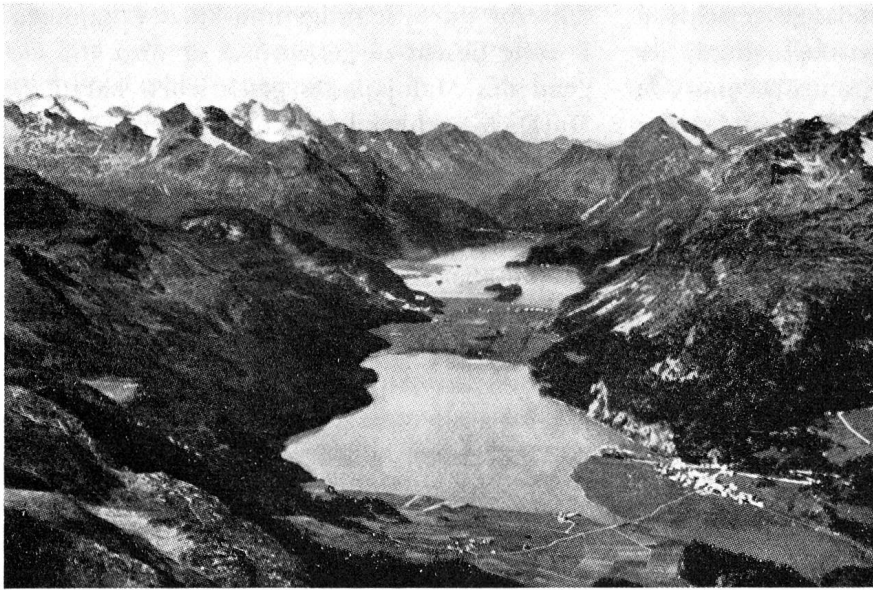
Das Oberengadiner Seental und sein alter Hintergrund im Bergell

Diese alpine Vereisung hatte natürlich mit ihren gewaltigen Eismassen — im Gebiet des Berninazufusses, also im heutigen Becken von Samedan, mit über 1000 m Mächtigkeit — einen sehr großen Einfluß auf die Talgestaltung. Der größte Teil dieser riesigen Gletscher floß talaufwärts über die weit geöffnete Pforte des Malojapasses. Es kam also zur berühmten Transfluenz des Oberengadiner Eises ins Bergell. Es ist die schönste und mächtigste Transfluenz im gesamten Alpengebiet. Talaufwärts zeigende Schliffrichtungen an den heutigen Talflanken beweisen sie. Das Engadiner Eis ist also aus der Gegend von Pontresina/Samedan talauf über den Malojapaß geflossen und dort in unvorstellbaren Eiskaskaden zur schon fast vollständig bestehenden Bergeller Furche hinuntergestürzt. Von hier gelangte das Eis bis in die Gegenden von Lugano und Varese. Reste von Juliergranit in den dortigen Moränen zeugen davon.