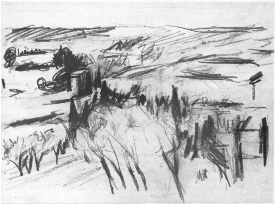
PETER METTIER: PROVENÇALISCHE LANDSCHAFT (IN DER NÄHE VON AVIGNON), BLEISTIFTZEICHNUNG