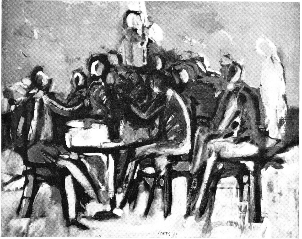
GEORGES ITEM: LE BISTRO