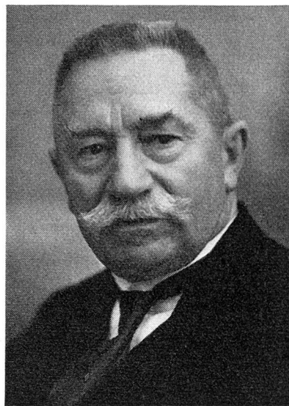
Andreas Laely Ständeratspräsident 1932/33

den einen Glückfall bedeutete und dem Gewählten den raschen Eintritt in die eidgenössische und internationale Wirksamkeit ermöglichte. Zwar blieb Calonder in Bern durchaus nicht unangefochten. Er hatte dies seiner prononcierten Verkehrspolitik zuzuschreiben, war er doch als Exponent der Splügenbahn bekannt und damit bei den Gotthardkantonen scheidel angesehen. Doch ungeachtet dieser Belastungen setzte sich Calonder in Bern durch. Die äußere Auszeichnung, die ihm zuteil wurde, bestand in der Verleihung des Präsidiums des Ständerates für das Jahr 1912. Noch im gleichen Jahr wurde er in den Bundesrat portiert, mußte indessen eine Niederlage einstecken. Doch im folgenden Jahr 1913 konnte er diese Scharte auswetzen, und Bünden erhielt mit ihm seinen zweiten und bis anhin letzten Bundesrat.