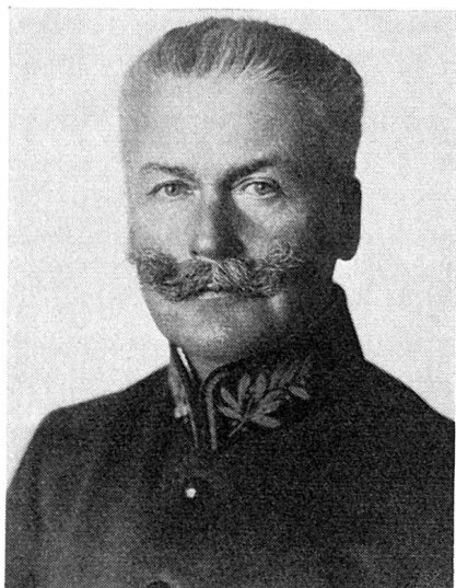
Friedrich Brügger Ständeratspräsident 1918/19