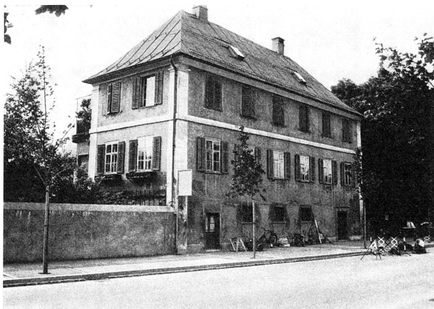
Das Stuppishaus an der Churer Masanserstraße. Droht ihm die Gefahr eines Abbruches?