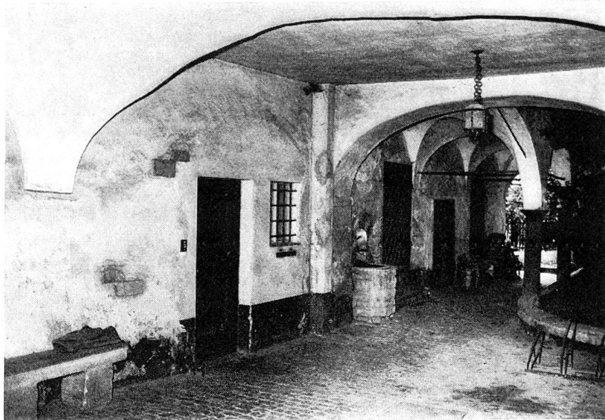
Blick in den großen, ebenerdigen Hofraum des Stuppishauses, in dem einst die Söldner auf ihre Abfertigung warteten.

Begabung und sein Können, seine Tapferkeit und seinen eisernen Willen, doch war es eine Größe, die nur auf sich selbst und seinen eigenen Vorteil ausgerichtet war. Das Urteil seiner Zeitgenossen über ihn war aus Neid, Haß, Verachtung und Bewunderung zusammengesetzt. Wohl war er eine der glänzendsten Gestalten seiner Zeit, doch haben sein Glanz und sein Ruhm ihn nicht überlebt.