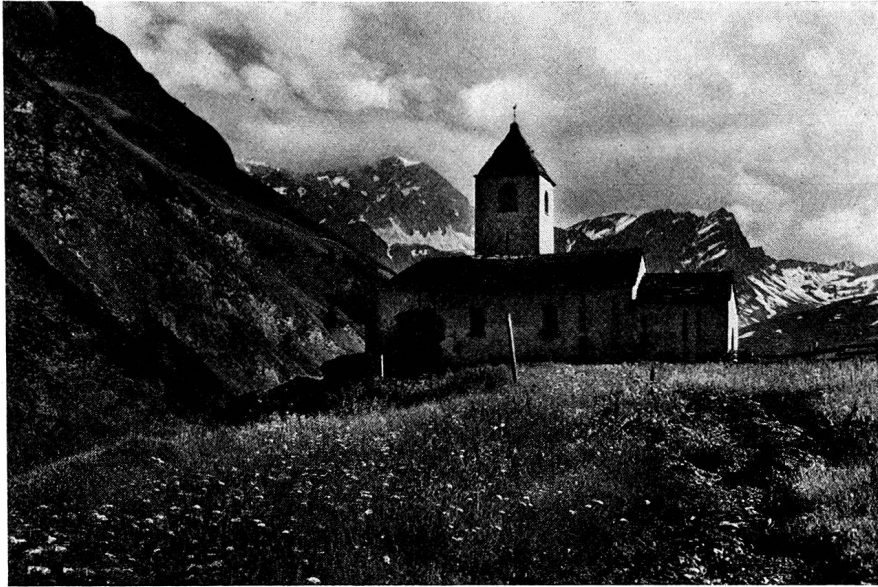
Kirche in Thalkirch, erbaut 1441.