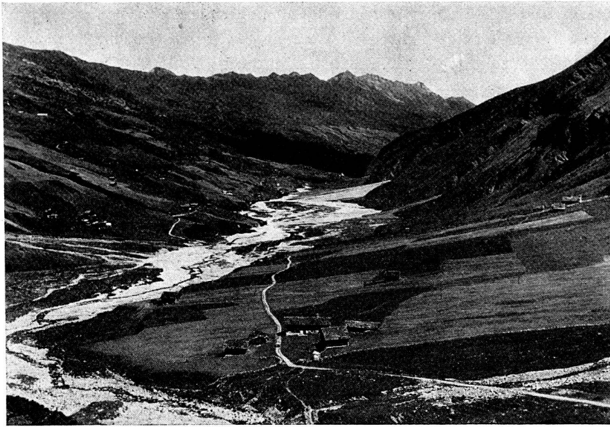
Verwüstungen durch Hochwasser und Rufen.

Hochwasser wütete, alle Brücken und Wuhre zerstörte im ganzen Tale und Wohnstätten bedrohte und wie Mißwachs und Teuerung Kummer und Not verursachten. Das Bündner Monatsblatt 1957 hat darüber vom Schreibenden eine ausführliche Darstellung gebracht.