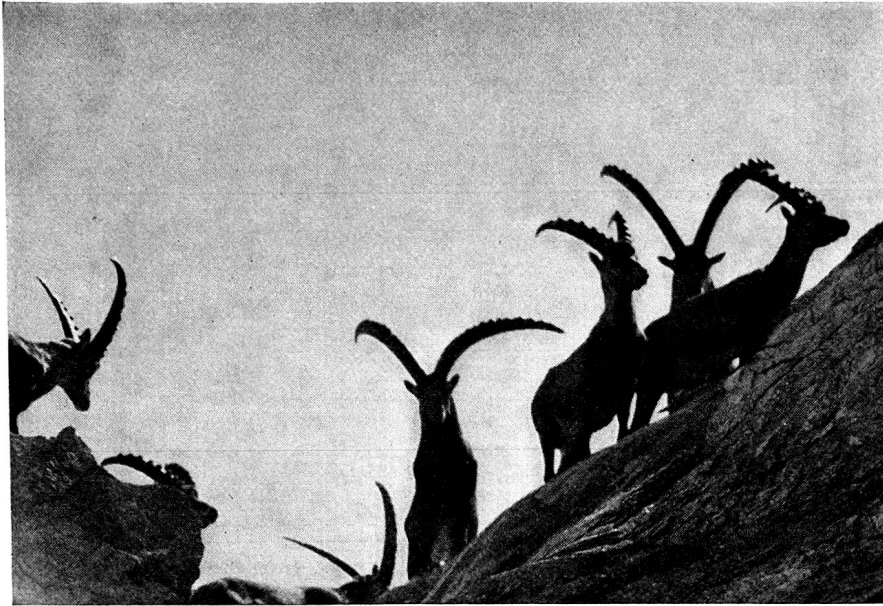
Steinbockgruppe der großen Kolonie beim Gelbhorn in Safien.

Man sollte meinen, eine so einseitige Ernährung wäre der Gesundheit nicht zuträglich gewesen. Die Molken enthalten aber, wie die Mediziner des Altertums schon feststellten, alle Stoffe, Vitamine sagt man heute, die der menschliche Körper nötig hat. Es ist also begreiflich, daß die Bergler gesund und stark blieben bis ins hohe Alter.