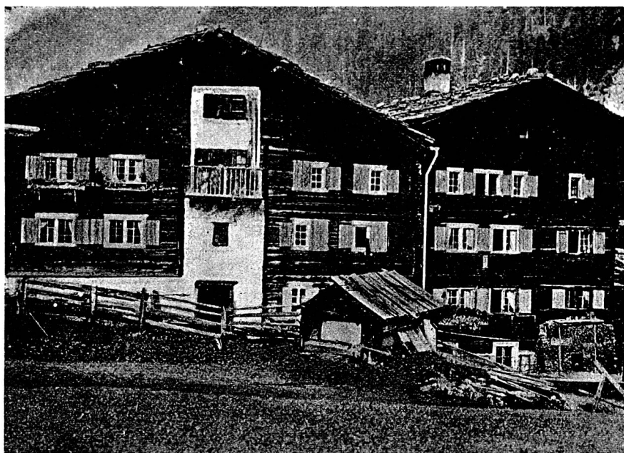
Der Landsgemeindeplatz in Safien beim Rathaus (rechts).