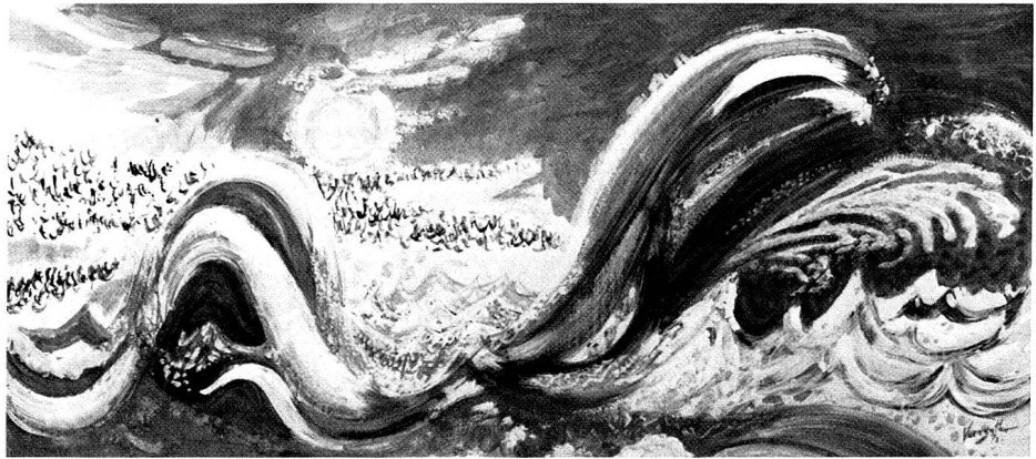
Gelbe Welle in der Gischt, 1972