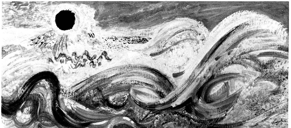
Sturm, Gischt und Sonne, 1973