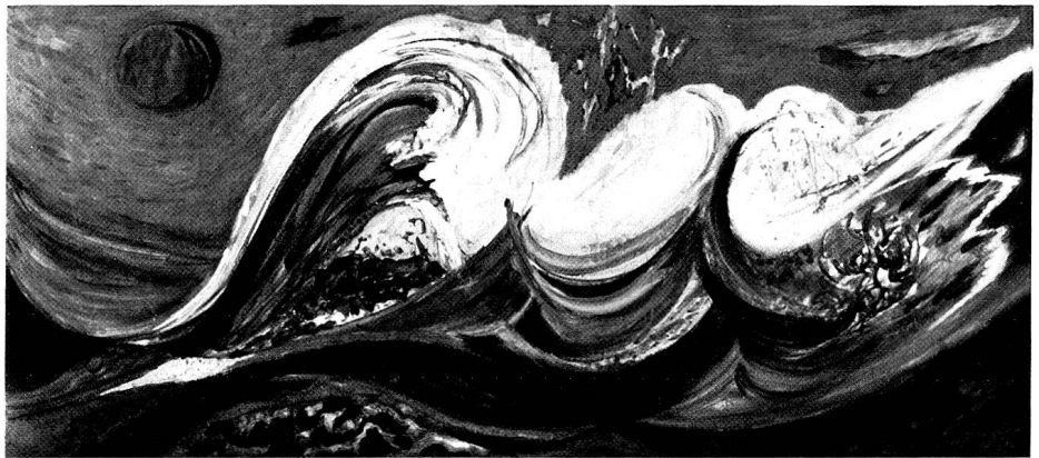
Grüne Wellen im Sturm, 1972