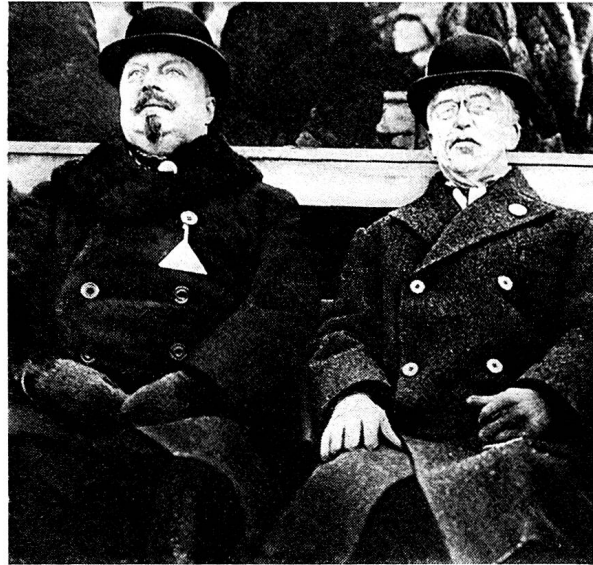
Bundespräsident Schulthess rechts, Prinzgemahl von Holland links.

St. Moritz 1928 war an einigen Tagen während der Spiele eine wahre Wetterhölle. In den Organisationskomitees wurde mit einer an Aufopferung grenzenden Hingabe gearbeitet, und speziell die Gemeinde und der Kurverein St. Moritz scheuten vor keinen Kosten zurück, um eine Garantie dafür zu erhalten, daß die Spiele wirklich in würdigem Rahmen durchgeführt werden konnten. Dabei wurde die Sache den St. Moritzern wahrlich nicht leicht gemacht. Lange vor dem Beginn der Spiele waren viele Widerwärtigkeiten zu überwinden. Schon der Schanzenbau verschlang \frac{1}{4} Million, und auch sonst kostete die Vorbereitung der Veranstaltung eine Riesensumme. Später kamen die Unterkunftssorgen. Es ist auch für einen Ort vom Range des Weltkurortes St. Moritz keine Kleinigkeit, über den normalen Betrieb hinaus mehr als tausend Wettkämpfer, Offizielle und Presseleute zum Teil für mehrere Wochen zu beherbergen. Als schließlich die Sache zu klappen schien, als alles aufs beste vorbereitet, organisatorisch bis ins kleinste Detail ausgetüftelt war, da meldete sich das Tauwetter als neuer Spielver-