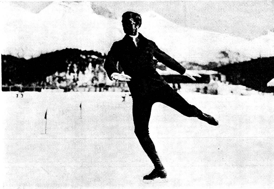
Der Schwede Gillis Grafström eroberte die zweite olympische Goldmedaille. Olympische Winterspiele 1928.

ser Eindruck aber ist geblieben; wir haben seither nie mehr ein so schweres Rennen mitbeobachten können.