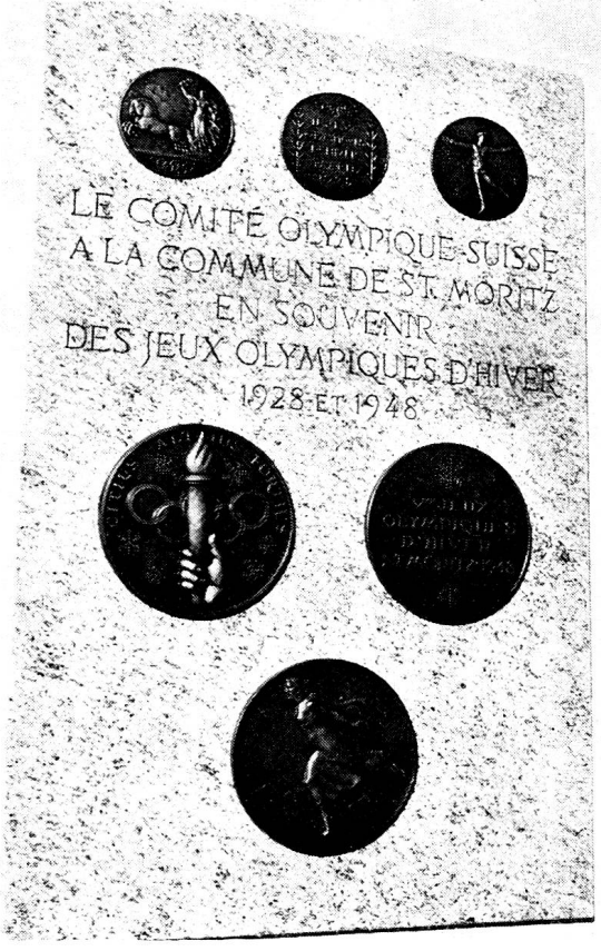
Olympia-Tafeln beim Rathaus.