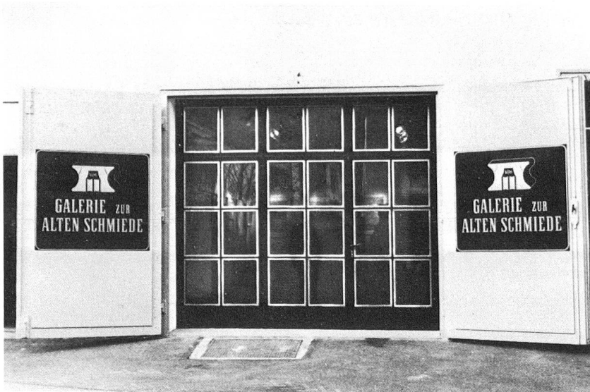
Galerie «Zur alten Schmiede» in Thusis