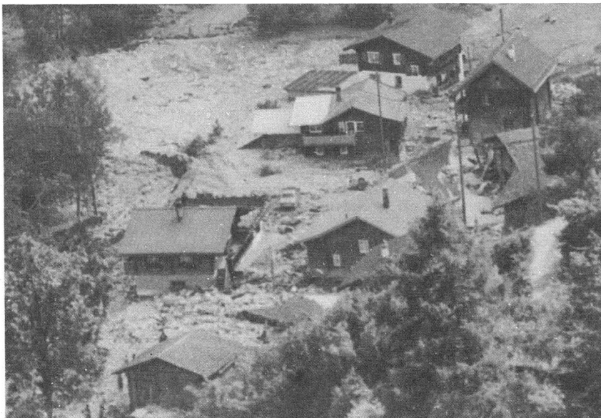
So katastrophal sah es nach dem Rüfegang in Molinis aus.

Noch viel schlimmer ging es in Molinis zu und her. Ein innert Minuten zu einer reissenden Rüfe angeschwollener Seitenbach aus dem Fatschazertobel durchbrach Wuhrbauten und schoss mit ungebändigter Wucht auf das Dorf zu. Schlamm und Steine überschwemmen Häuser und Ställe. Durch ein Fenster drang das Geschiebe in die Kirche, staute