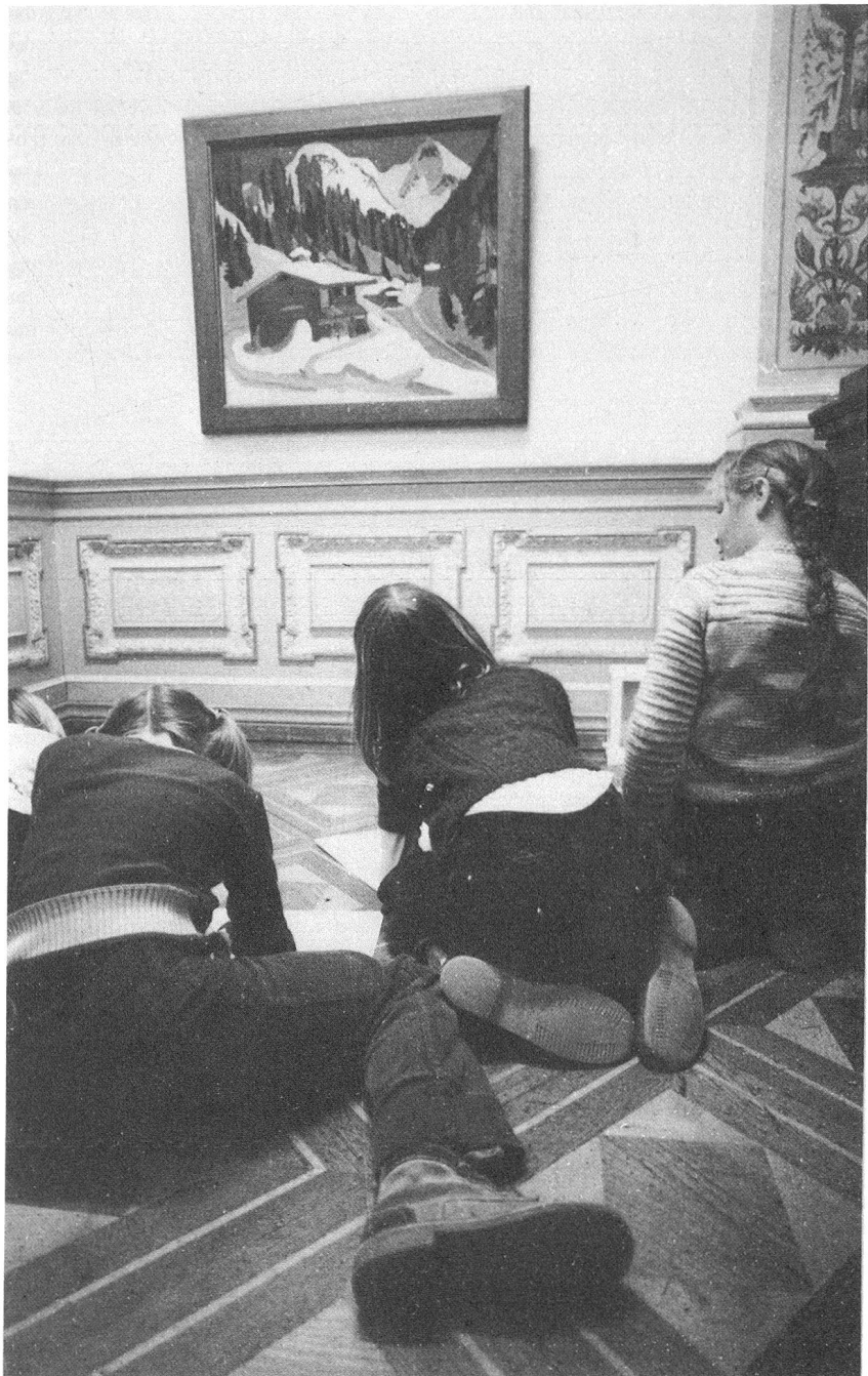
Zeichnende Schüler in der Kirchner-Ausstellung

In unserem Kunstmuseum war vom 18. 5. – 15. 6. 1980 eine Wanderausstellung zu Gast, die TELEFONZEICHNUNGEN von drei arrivierten Künstlern präsentierte. Franz Eggenschwiler , Alfonso Hüppi und Dieter Roth , geistig