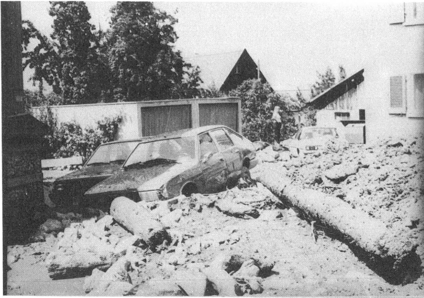
Das richteten in Trimmis Schlamm, Geröllmassen und Holzstämmen an.

sich in Trimmis und besonders in Molinis verheerend aus.