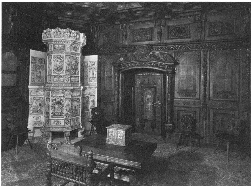
Täfer der Prunkstube.

bens und Wirkens. Das Schlösschen hatte ein Wahrzeichen des Namens und der Grösse seines Geschlechtes, zum Ruhme der jetzigen und kommenden Generationen zu sein. Es sollte nicht nur die gehobene Wohnkultur, die auch in Graubünden Einzug zu halten begann, aufzeigen, sondern auch den gehobenen Stand, den Adel seines Erbauers betonen. Als äusseres, weit sichtbares Zeichen war es der dem Gebäude angefügte Turm, der den Standesunterschied zum Ausdruck brachte, so wie die früheren Ritterburgen durch den Wohnturm, aus dem sie entstanden sind, gekennzeichnet waren. Wenn aber eine Burg des 12. und 13. Jahrhunderts ohne Turm gar nicht denkbar war, so wenig berechtigt, ja sinnlos war er für einen Bau in den späteren Jahrhunderten. Wie die Türme der Schlösschen Rosenroll in Thusis, Buol in Parpan, Travers in Paspels und manch' andere zeigen, haben sie keinen anderen Zweck, als dem Gebäude ein schlossähnliches Aussehen zu geben.